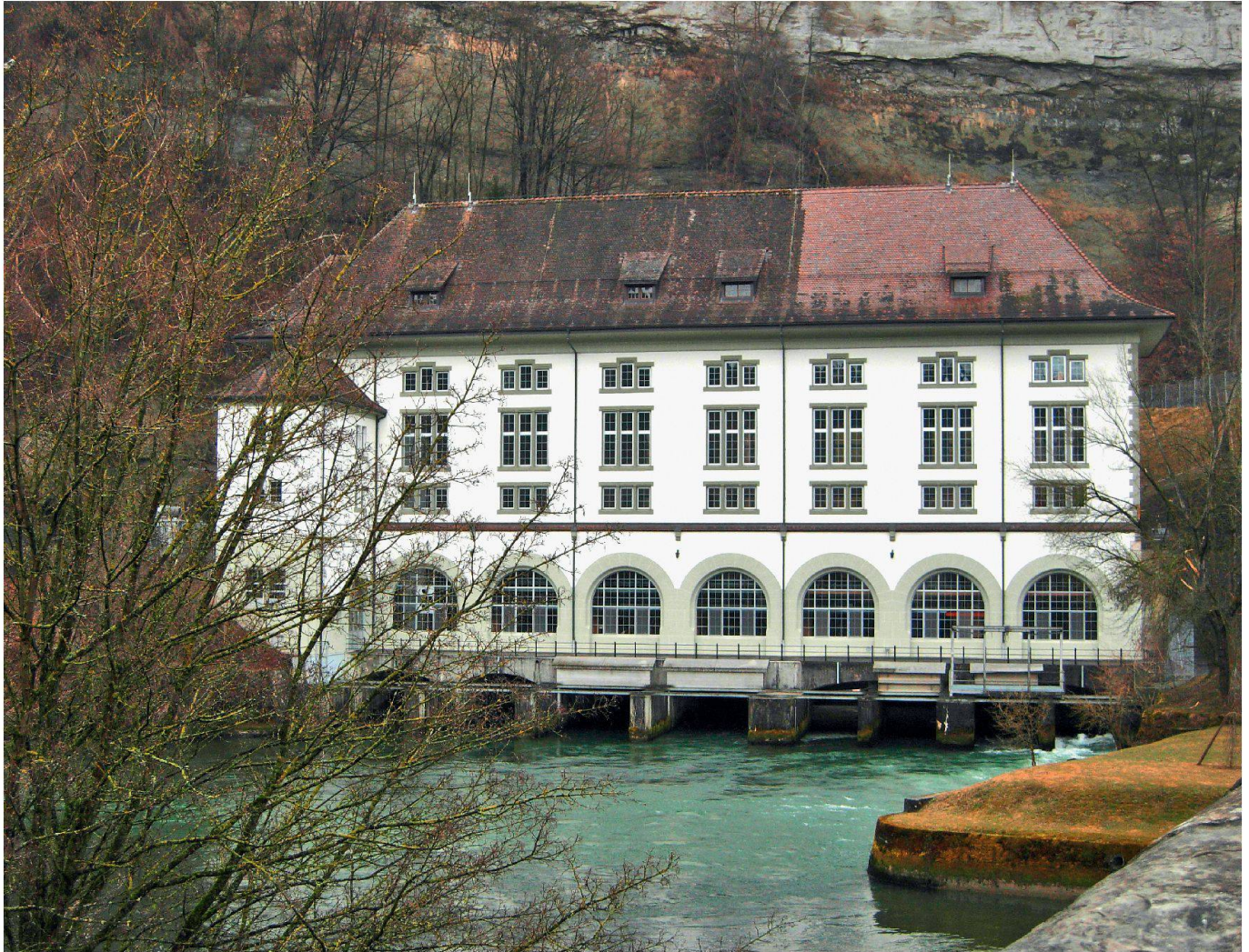
Lors des Journées européennes du patrimoine, l'usine électrique de l'Oelberg (1910) près de Fribourg, alimentée par l'eau de la Sarine, sera ouverte au public.

Das Elektrizitätswerk Oelberg bei Freiburg von 1910 wird vom Wasser der Saane betrieben. Es kann am Tag des Denkmals besucht werden.