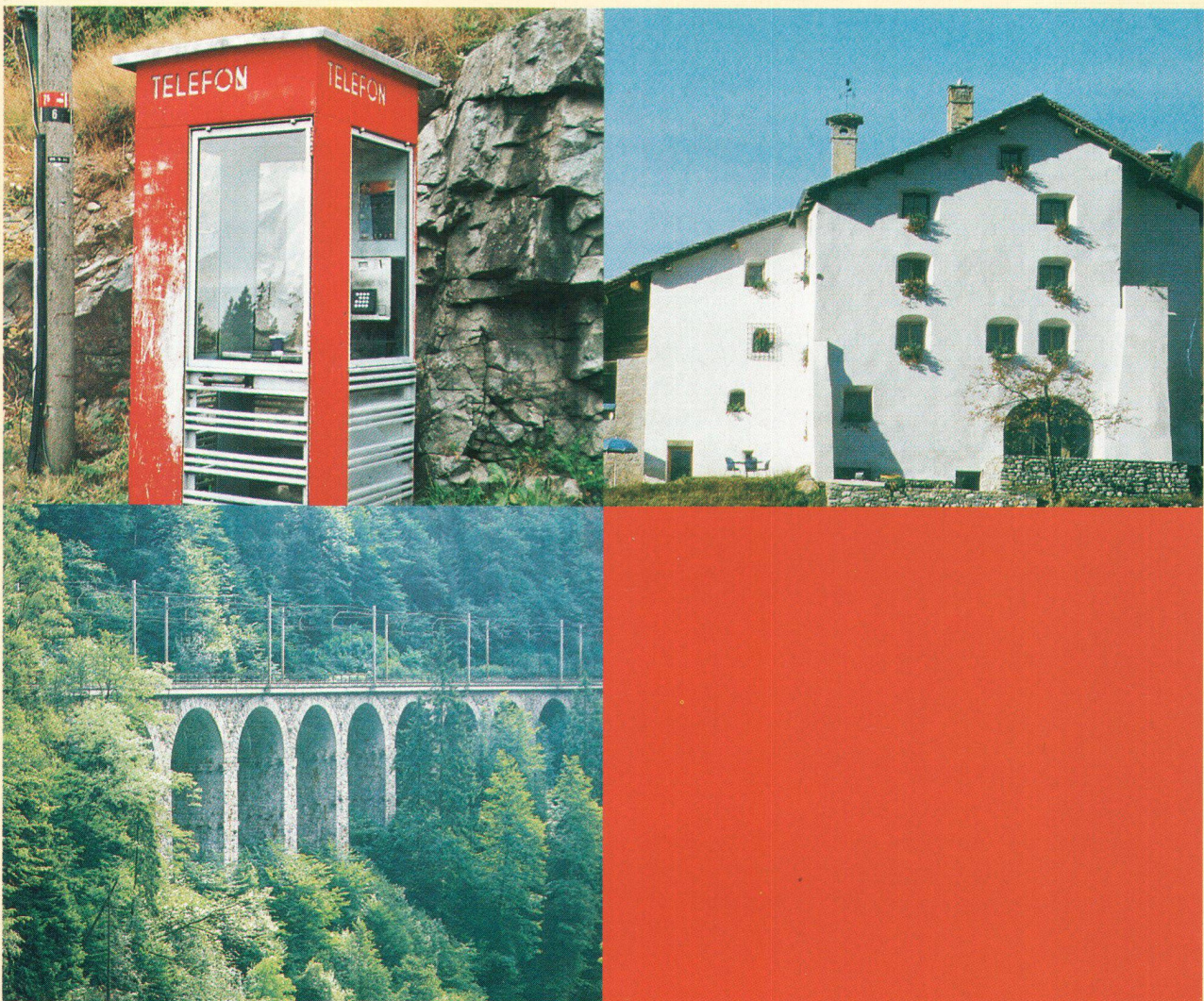
Heimatschutz im Ausland: Telefonkabine als Baudenkmal in Norwegen Tourismus und Heimatschutz: Weisses Kreuz in Splügen GR Neat: Noch fährt die Gotthardbahn auf der Bergstrecke