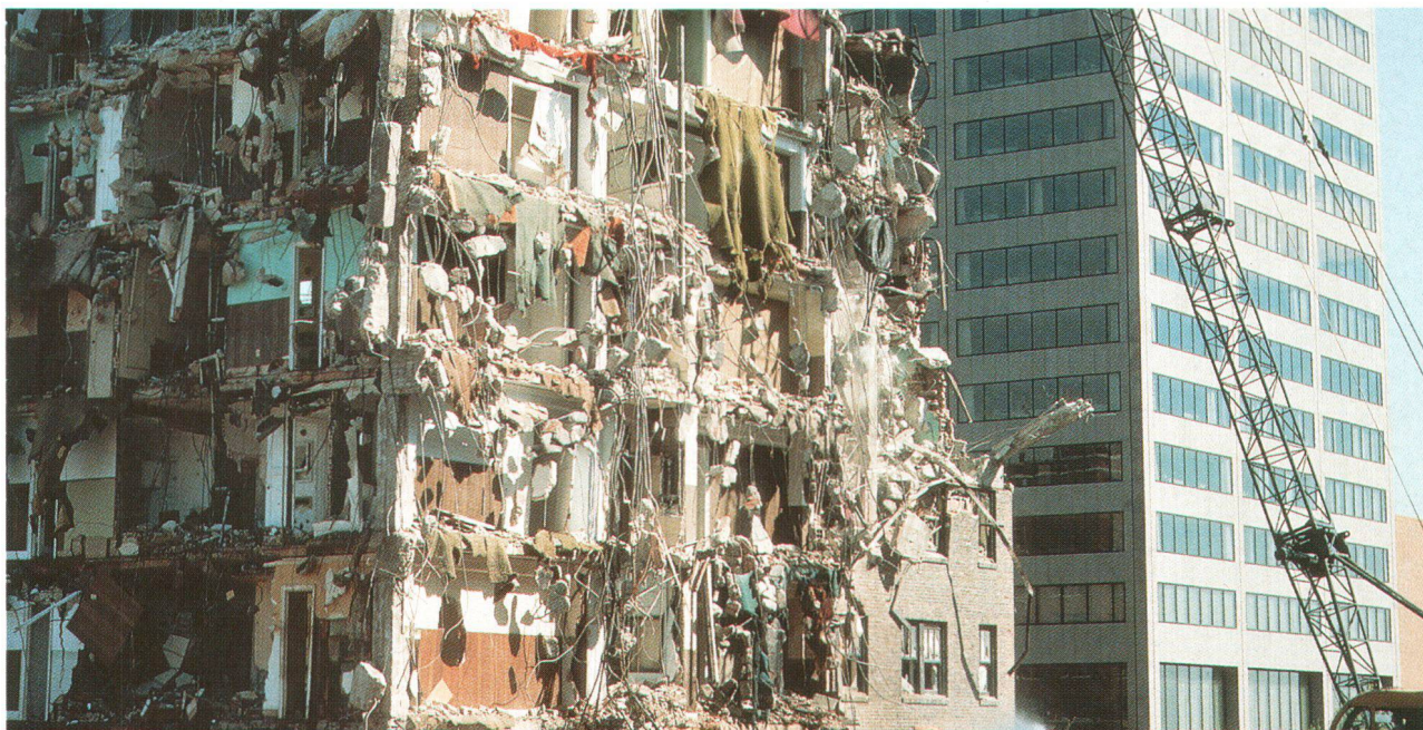
Bild Titelseite: Neben den massiven Bauteilen sind vor allem die Haustechnik und der Innenausbau an der Umweltbelastung von Gebäuden beteiligt.

Ce sont surtout, outre le gros œuvre, les installations techniques et les aménagements intérieurs qui contribuent à augmenter la charge sur l'environnement.