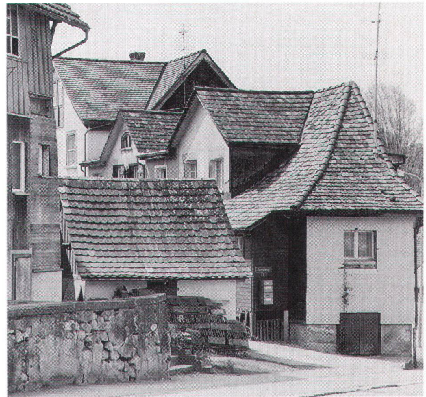
Zeugen der gewerblich-industriellen Vergangenheit prägen den Siedlungskern, obwohl die meisten Häuser mittlerweile anders genutzt werden.

Das Kanalsystem, ohne das die Geschichte Hauptwils nicht denkbar wäre, liegt heute zum grössten Teil verrohrt unter dem Boden. Hier sind Überlegungen anzustellen, wie und wo die Kanäle wieder erlebbar und lesbar gemacht werden können. Zudem: Der Ortskern von Hauptwil wird vom Durchgangsverkehr zerschnitten. Jede strassenbauliche Massnahme wird sich künftig daran messen müssen, welchen Beitrag zur Schonung und Verbesserung des Ortsbildes sie leistet. Auch wenn die historische Bedeutung Hauptwils heute unumstritten ist, so muss doch gesagt werden, dass die massgeblichen Quellen, u. a. das Gonzenbach-Archiv, nicht aufgearbeitet sind. Auch hier müssen Mittel und Wege gefunden werden, dass die