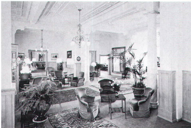
Oben: Kurhaus Flühl; Mitte: «Schweizerhof» Flims; Unten: Hotel «Albrici» Poschiavo. En haut: le «Kurhaus» de Flühl; au milieu: le «Schweizerhof» de Flims; en bas: l'hôtel «Albrici» de Poschiavo.