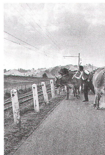
Ci-dessus: «Der Vater», de Theo Frey (1936); ci-dessous: «Alpabfahrt», d'Eliza Lima (1995).