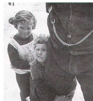
Oben: «Der Vater» von Theo Frey (1936); unten: «Alpabfahrt» von Eliza Lima (1995).

richtete Fachtagung über «Umnutzung – Wakker-Preis 1997 Bern». Ihr roter Faden: mit welchen Argumenten und Fragen wird man bei einer Umnutzung konfrontiert? Ferner stehen öffentliche Führungen durch umgenutzte Industrieanlagen auf dem Programm. Gleichentags übergibt der Schweizer Heimatschutz der Stadt Bern offiziell den Wakker-Preis 1997. Abschliessend erhalten die Unverdrossenen noch die Gelegenheit, mit drei Exkursionen Unbekanntes in der Umgebung von Bern zu besuchen. Nähere Unterlagen hält die Regionalgruppe Bern des Berner Heimatschutzes, Postfach, 3000 Bern 7 bereit.