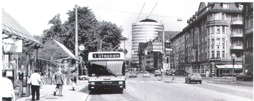
In St. Gallen gab der Souverän grünes Licht zur weiteren Bauverdichtung.

Analysiert man die drei Urnengänge auch nur grob, lassen sich daraus etwa folgende Schlüsse ziehen: Ein erstaunlich hoher Anteil der Bevölkerung ist heute gegenüber heimat-schützerischen Anliegen sensibilisiert und erwartet, dass diese in der Politik angemessen berücksichtigt werden. Trotz der angespannten Finanzlage der öffentlichen Hand und den Unkenrufen gewisser Parteien und Behördenmitglieder scheinen die Stimmbürger auch nicht blindlings bereit zu sein, Geld und Sparargumente gegen solche des Schutzes und der Pflege unseres Lebensraumes und unserer Kulturgüter ausspielen zu lassen. Aber ebenso wenig wünschen sie überrasene Projekte oder Forderungen, von deren Nutzen für die Allgemeinheit sie nicht überzeugt sind und deren Finanzierung ein Abenteuer mit ungewissem Ausgang erwarten lässt. Um so chancenreicher sind klar durchschaubare und pragmatische Lösungsansätze – wobei die Erfolgsaussichten um so grösser sind, je konkreter, verständlicher und leichter umsetzbar die Aufgabe anmutet. Projekte und Anliegen hingegen, die hohe Ansprüche an das Abstraktionsvermögen und die Fachkenntnisse der Urnengänger stellen, wie etwa im Falle von St. Gallen, oder die verschwommene Ziele verfolgen und daher einen hohen Erklärungsbedarf nach sich ziehen, haben es erheblich schwerer, verstanden und angenommen zu werden.