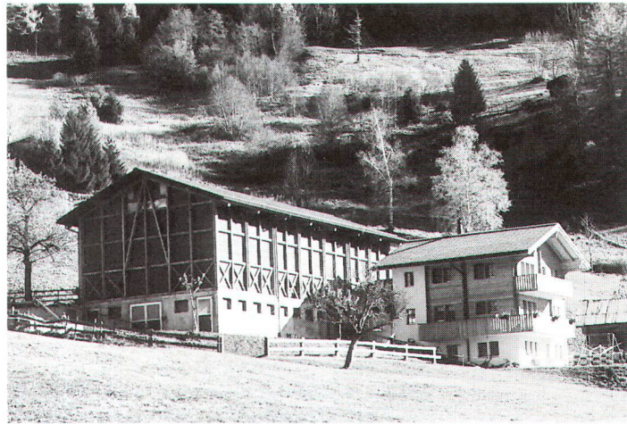
Hier wie dort haben Meliorationen ihre Spuren in der traditionellen Kulturlandschaft hinterlassen.

Wer nach Elm kommt, dem fällt eine Besonderheit sofort auf: Die Vorherrschaft des hölzernen Blockhauses, das noch heute den Ortscharakter bestimmt. Vom «Sulzbach» bis zum «Müsli» und vom «Dorf» bis «Hintersteinibach» zeugen diese stattlichen Gebäude vom Geschick der einheimischen Handwerker, die hier bis weit ins 19. Jahrhundert hinein ausschliesslich diesem Haustyp verpflichtet waren und dabei Werke von hoher Qualität schufen. Ihre integrale Erhaltung und eine Reihe von modernen Neubauten, die sich in Form, Konstruktion, Material und Farbe bald an die überlieferten Strukturen anlehnen und bald in einer spannungsvollen und doch verträglichen Beziehung zu diesen stehen, waren 1981 bei der Preisvergabe an Elm im Mittelpunkt der heimat-schützerischen Überlegungen. Ausgezeichnet werden sollte darüber hinaus ein Gemeinwesen, das trotz seiner Standortnachteile auch in