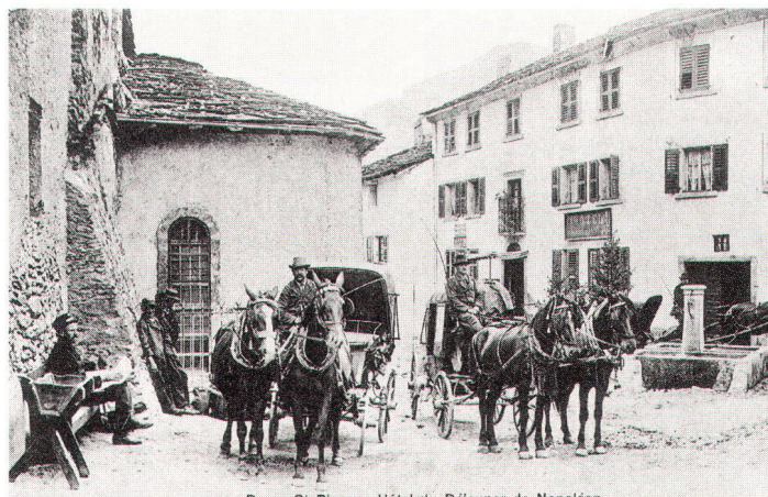
Pässe wie der Grosse St. Bernhard wurden bis in die Postkutschenszeit hinein – unser Bild zeigt eine Szene vor dem Postbüro in Bourg-St-Pierre – intensiver benützt als der Gotthard.

Zu den Schlüsselmerkmalen des helvetischen Strassennetzes gehören zweifellos seine zahlreichen und aufwendigen Tunnel- und Brückenbauten, von denen hier nur die längsten und auch von den internationalen Verkehrsströmen am stärksten benützten Strecken erwähnt seien: die N13 mit dem in den 70er Jahren eröffneten San-Bernardino-Tunnel und die N2 mit dem 1980 dem Verkehr übergebenen Gotthard-Strassentunnel. Insbesondere der letztere, mit seinen 16,3 Kilometern der längste Strassentunnel der Welt und mit seinen Zufahrten zweifellos ein ingenieurtechnisches Meisterwerk, wurde bei seiner Einweihung euphorisch als «Jahrhundertbau» gefeiert. Doch seine Folgen haben nicht lange auf sich warten lassen und den umweltschützerisch motivierten Skeptikern recht gegeben. Jahr für Jahr schnellte auf dieser Strassenachse der private Transitverkehr an, nicht weniger der ökologisch noch bedenklichere