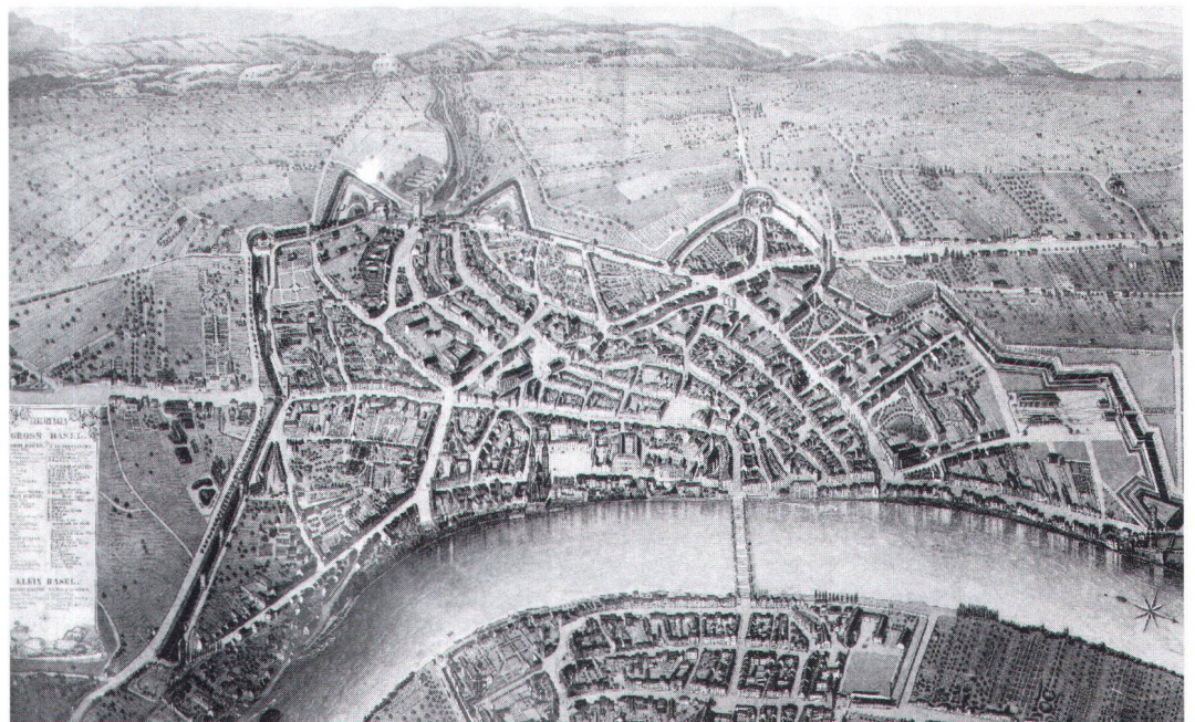
Les temps sont passés où la ville formait un ensemble bien circonscrit. Die Zeiten, wo die Stadt ein geschlossenes Ganzes bildete, sind vorbei