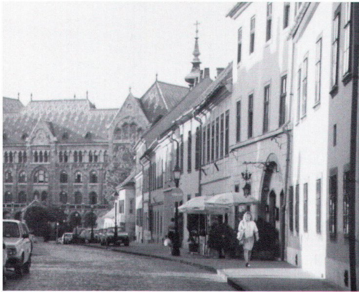
Dans le quartier du château de Buda. Im Schloss-Quartier von Buda.

riété d'influences: églises bénédictines, basiliques, temples calvinistes et luthériens, églises orthodoxes, synagogues et quelques rares mosquées. Outre les châteaux, dont certains témoignent des fastes de l'époque baroque, le patrimoine hongrois s'enrichit de nombreux autres édifices qui rappellent les conditions de la vie quotidienne: maisons rurales, moulins, etc. A Budapest, outre la colline de Buda et le cours majestueux du Danube, des bâtiments et des quartiers caractéristiques du début du siècle retiendront l'attention du visiteur averti. Les courants de l'Art Nouveau et de la Sécession ont laissé des témoins dignes d'intérêt. En province, dans de petites villes telles que Kecskemet, on découvre d'étonnants édifices de cette époque.