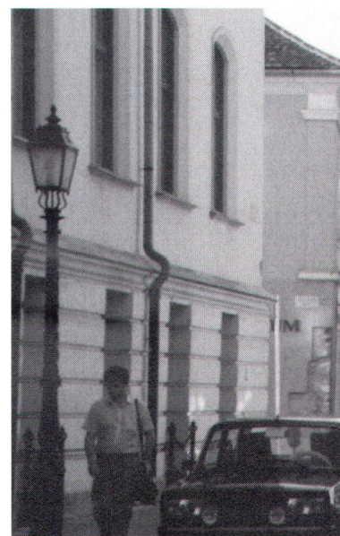
A gauche: Synagogue de Zalaegerszeg transformée en salle de concert. Links: Die Synagoge von Zalaegerszeg ist zum Konzertsaal umgewandelt worden.