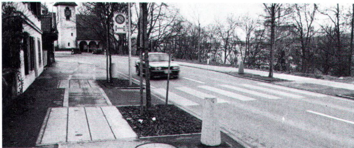
Redimensionierte Sinsstrasse mit Verengung bei Fussgängerstreifen.

In dieser Alltagsarbeit wird die Gemeinde Cham durch den Wakker-Preis bestärkt, zugleich aber auch ermahnt, den hohen Zielen der Ortsplanung jederzeit gerecht zu werden.