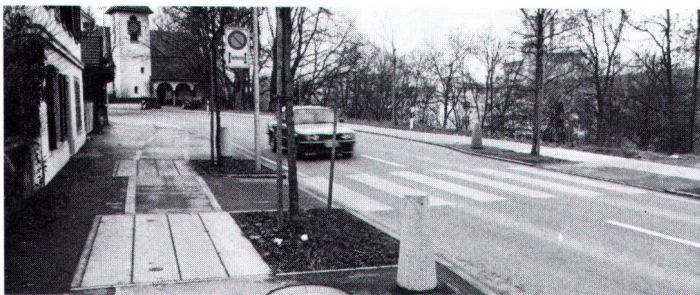
Redimensionierte Sinsstrasse mit Verengung bei Fussgängerstreifen (Bild Borner).

In dieser Alltagsarbeit wird die Gemeinde Cham durch den Wakker-Preis bestärkt, zugleich aber auch ermahnt, den hohen Zielen der Ortsplanung jederzeit gerecht zu werden.