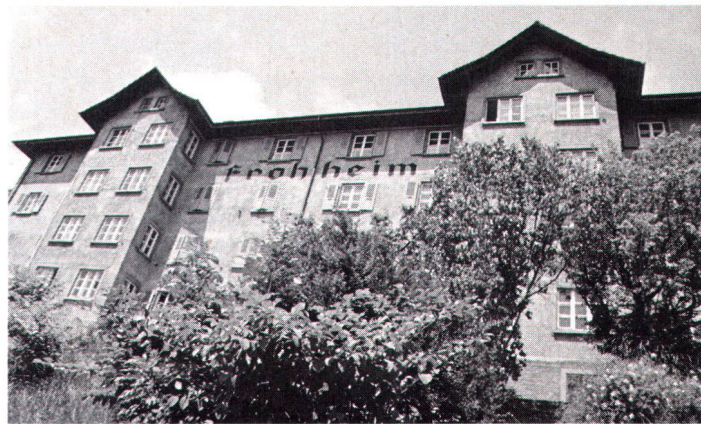
Das «Frohheim» in Grächen, welches hätte abgerissen werden sollen.