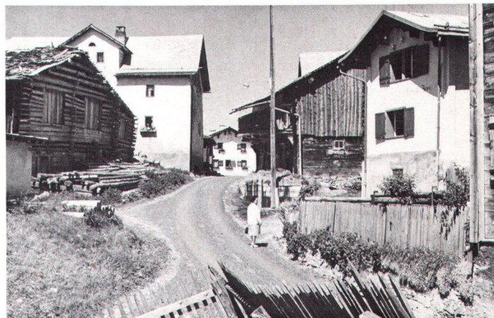
Dans nos villages de montagne, les maisons n'ont pas toutes le confort auquel on peut prétendre aujourd'hui. Aussi la LSP demande-t-elle que la Confédération contribue aux frais supplémentaires qu'exige un entretien conforme à la protection du patrimoine.

L'attitude entreprenante de la Commune est d'autant plus louable qu'elle était et est exposée à une pression considérable due à l'afflux d'habitants, aisément concevable si l'on songe que depuis 1950 la population a doublé et dépasse aujourd'hui les 10000 âmes. Les nombreux hameaux situés en zone agricole restent en dehors des zones à bâtir. Ils y restent aussi dans le «plan de zones 1990», mais en plus, certains d'entre eux sont mis en «zones de sites à protéger». Le premier des deux objectifs se reflète dans le statu quo pour