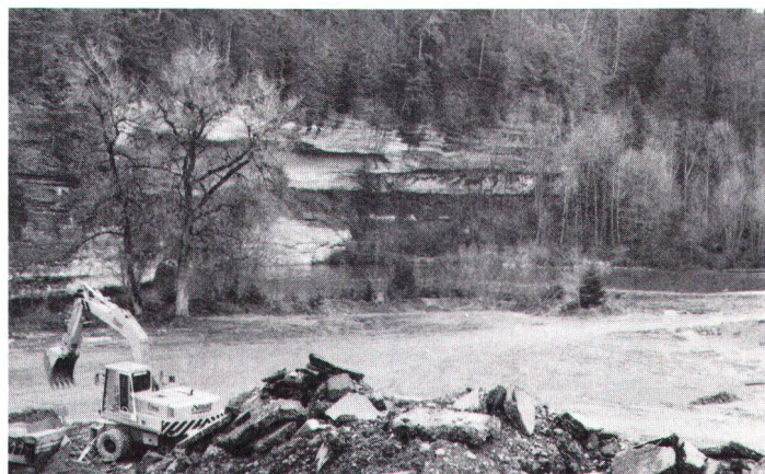
Retraitement de matériaux de construction en zone protégée. Bauschutttaufbereitung in geschützter Zone