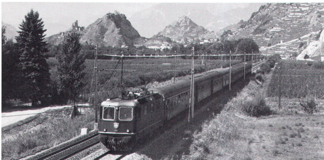
An der Simplonlinie bei Sitten (Archivbild). La ligne du Simplon près de Sion.

La SSPE propose donc, dans sa réponse à la consultation, que priorité soit donnée aux intéressés et à l'environnement dans le projet de transversale alpine.