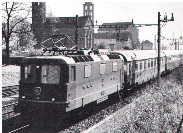
Gotthard-Zug bei Giornico. Un train du St-Gothard près de Giornico.

Die vorliegenden Untersuchungen über die Umweltauswirkungen zeigen, dass für die NEAT ein hoher ökologischer Preis zu zahlen sein wird. Dieser Preis ist nur zu verantworten, wenn damit schlimmere Umweltauswirkungen, wie zum Beispiel ein weiteres massives Ansteigen des Motorfahrzeugverkehrs auf der Strasse, vermieden werden können. Die Schweiz steht bezüglich des Strassen-Transitverkehrs unter einem grossen Druck der Europäischen Gemeinschaft (EG), da im Zusammenhang mit der Schaffung des EG-Binnenmarktes das Verkehrsvolumen im