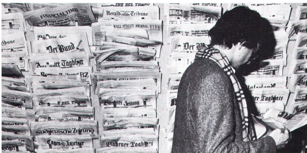
Die Presse, nach wie vor das meistbenutzte Medium (Bild & News).

son implantation régionale. Il faut lui réserver les informations qui nécessitent le complément d'un commentaire. Pour le traitement de questions spéciales de principe, la presse technique et professionnelle peut aussi être très utile et ne doit pas être négligée. D'une façon générale, il est important d'établir des relations personnelles et suivies avec des rédactions et des journalistes sur qui l'on peut compter. Un service d'informations écrites, occasionnelles ou périodiques, est sans doute le moyen le plus utilisé; il va du bref communiqué à l'exposé complet et illustré; les textes doivent être en tout cas concrets, actuels, clairs et aussi brefs que possible. Il ne faut pas abuser des conférences de presse, à réserver pour les cas très importants. Dans certains cas, elles peuvent être avantageusement remplacées par des entretiens, ou des séminaires, auxquels sont invités un petit nombre de journalistes particulièrement intéressés. Avec la radio et la TV, il est recommandé d'être exactement informé sur le but de l'émission et la liste des sujets prévus au programme; il faut préparer soigneusement son intervention, s'exprimer brièvement, et toujours garder son calme.