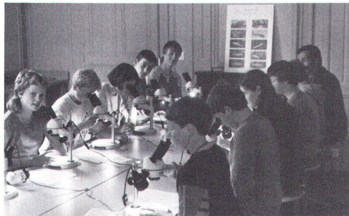
Ce sont surtout les camps et les semaines de vacances extra-scolaires qui se prêtent à l'enseignement de la protection du patrimoine. Vor allem Lager und ausserschulische Ferienwochen böten sich für heimatschützerische Kursthemen an.

L'école n'a heureusement pas le monopole de la formation. D'autres organismes, d'autres institutions mettent leurs compétences et leur dévouement au service du public en vue de l'instruction et de l'épanouissement de chacun. Les enfants et adolescents, soucieux d'échapper au carcan scolaire, ne sont pas des consommateurs volontaires de cours particuliers, du soir ou de vacances. En revanche, ils s'associent volontiers aux activités des groupements proposant diverses filières d'occupations extra-scolaires. Les groupements de jeunesse, structurés comme les éclaireurs, ou plus discrets dans leur encadrement, offrent aux jeunes des contacts, travaux et excursions dont les thèmes peuvent rencontrer nos intérêts de protecteurs du patrimoine.