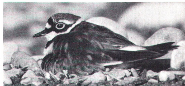
Le Petit Gravelot – un de ces habitants qui se font rares