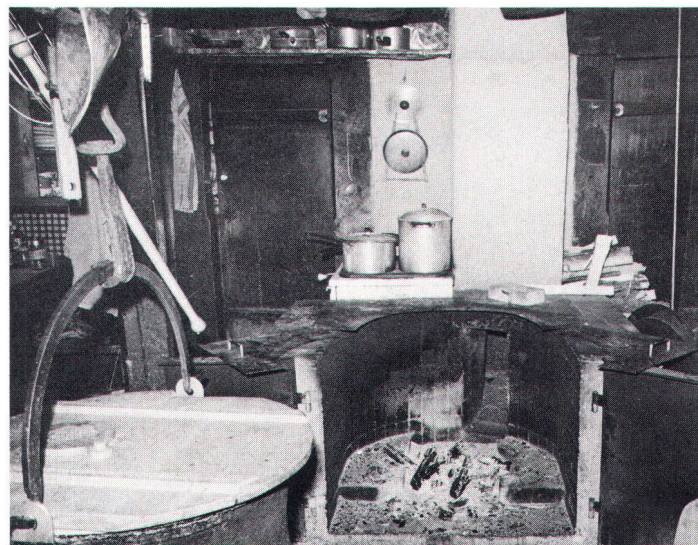
Bergkäserei im Diemtigtal

Die Diemtigtaler Alpen und Vorsassen, das Gebiet der Temporärsiedlungen und bevorzugtes Wandergebiet, zeigen Alpsiedlungen von grosser Ursprünglichkeit, seien das einfache Hütten und Ställe oder jene gewaltigen «Küherburgen» mit Vollwalmdächern, wie wir sie im Diemtigtal oft antreffen. Die Dausiedlungszone der acht Bäueren ist gesamthaft eine ausgesprochene Streusiedlung . In ihr finden wir nicht nur viele Bauten von ausserordentlicher Qualität (im Baureglement sind zurzeit 26 Schutzobjekte aufgeführt), sondern einen gesamthaft wertvollen Baubestand. Darunter fallen die reich geschnitzten und bemalten Häuser aus dem 17. und 18. Jh. besonders auf, die durch Baupflege und Restauration der Malereien eine hochstehende Bauernkultur verraten. Daneben gibt es aber eine grosse Zahl ebenfalls hervorragender Zeugen der Zimmermannskunst, deren Malereien noch zu restaurieren wä-