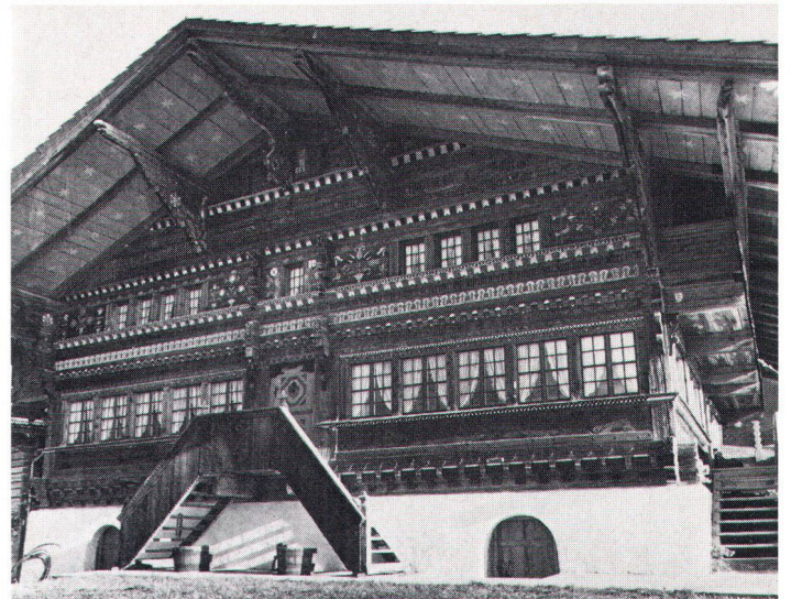
Stolzer Vertreter einheimischer Zimmermannskunst: das Selbenzenhaus in Bächlen

Die Unversehrtheit des Dorfes Diemtigen beruht auf dem Umstand, dass seit dem Strassen- und Bahnbau Oey am Ausgang des Tales zur Simme zum neuen Zentrum der Gemeinde wurde. Dieses ist aus dem ehemaligen «Armenviertel» zum typischen Bahnhofdorf des 20. Jahrhunderts geworden, wobei trotz gewisser Mängel solcher Dorfbildungen Oey sich als Ganzes massvoll entwickelte und seinen dörflichen Charakter behalten hat. Diemtigen hingegen blieb von dieser Entwicklung weitgehend unberührt. Um die Jahrhundertwende entstanden im Ortskern Neubauten, die zwar in ihrer Architektur mit dem älteren Baubestand nicht standhalten, aber als einfache Holzhäuser auch nicht auffal-