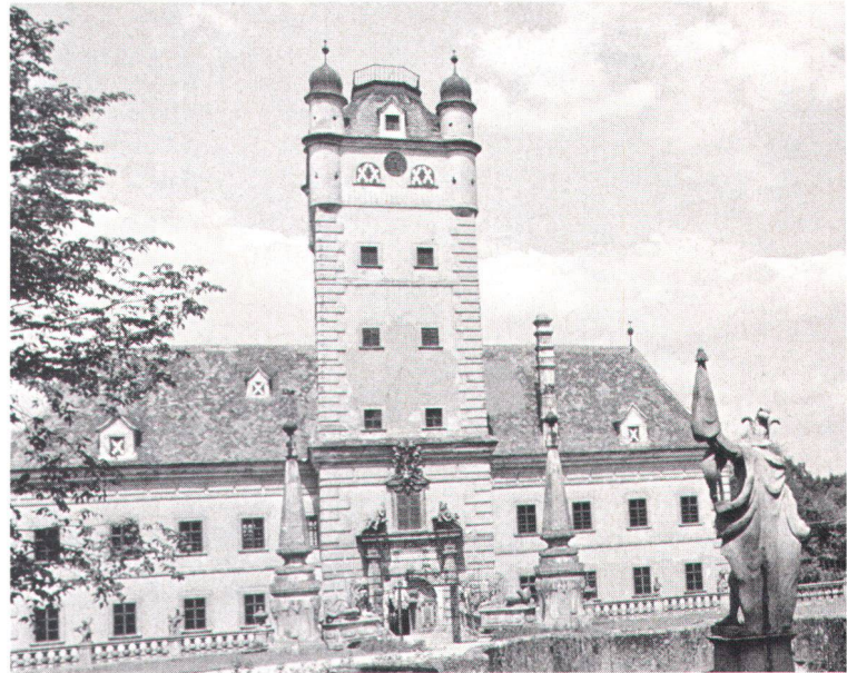
Schloss Greillenstein in Niederösterreich wird von seinem Privatbesitzer unter grossem Einsatz als Museum geführt

Eine schwerwiegende Besonderheit des inklusive der Strafbestimmungen 20 Paragraphen umfassenden Denkmalchutzgesetzes stellt der Paragraph 2 dar, wonach automatisch jedes Gebäude im öffentlichen oder kirchlichen Besitz so lange als Denkmal anzusehen ist, als das Bundesdenkmalamt nicht auf Antrag des Eigentümers das Gegenteil