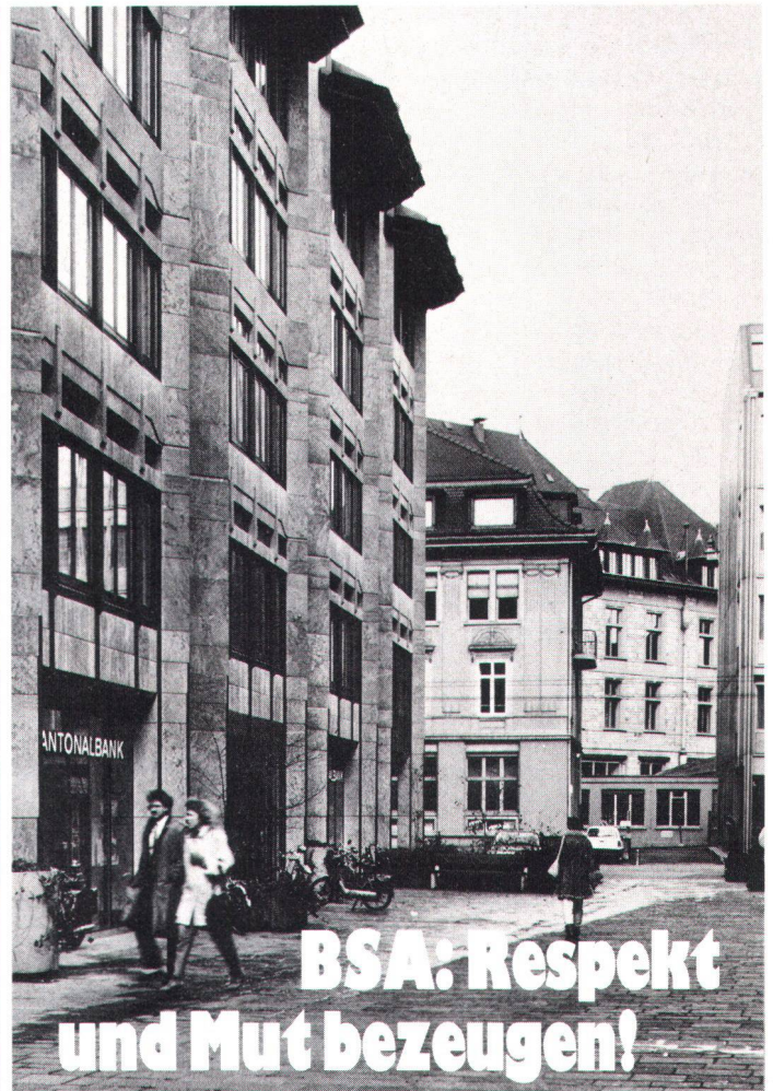
Oben: Eingliederung (Gebäude links) in der Winterthurer Altstadt ohne falsche Anbiederung