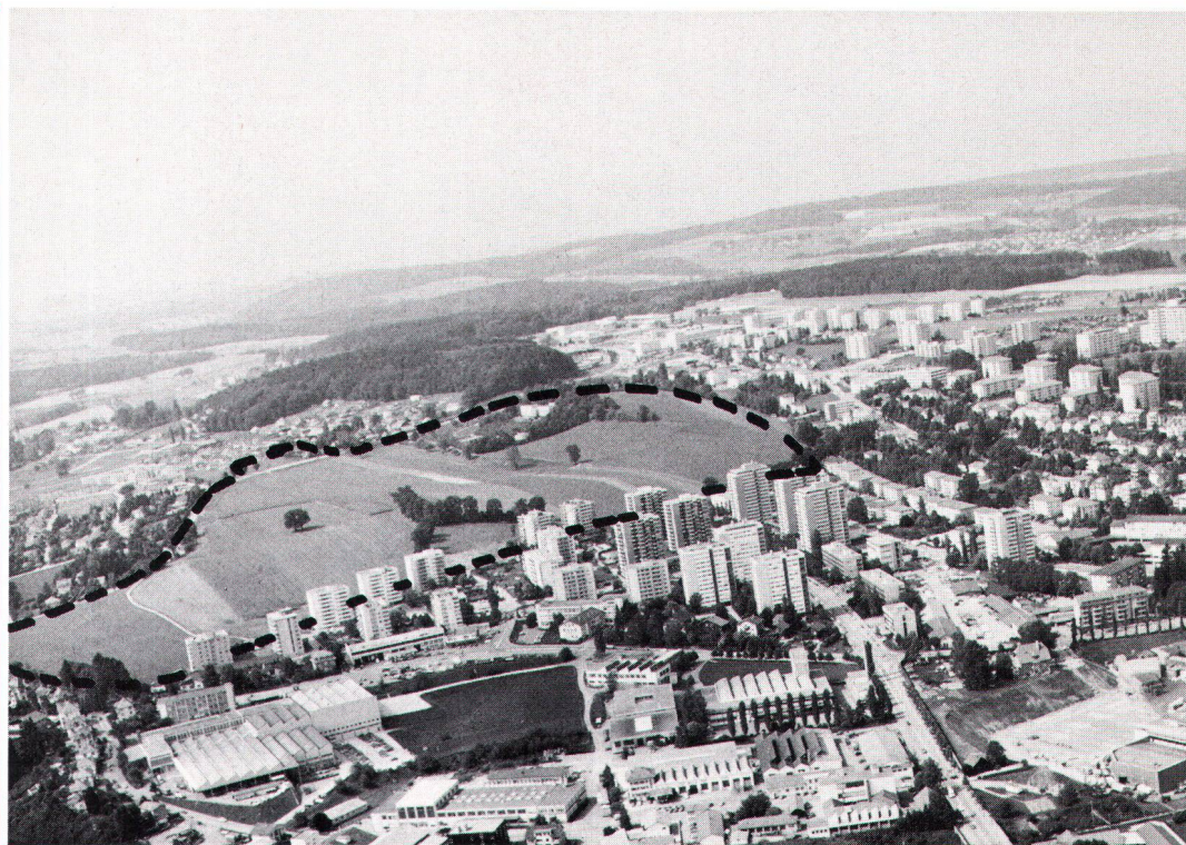
La ligne en hachures marque le périmètre prescrit pour le concours d'aménagement.

grundlage das klar umrissene (Raum)Programm fehlt, müssen sich Organisatoren, Gemeinwesen und Jury um so intensiver bemühen, die Problemstellung zu verdeutlichen. Dennoch hat sich der landesweit ausgeschriebene Planungswettbewerb von Villars-sur-Glâne im Urteil des Preisgerichts gelohnt. Während einige Arbeiten recht formalistisch und theoretisch ausfielen, hat der Grossteil der Teilnehmer mehr oder weniger geschickt versucht, möglichst konkrete Lösungen aufzuzeigen. Doch nur wenigen ist es gelungen, eine leicht umsetzbare Idee zu unterbreiten. Mit dem Wettbewerb ist jedoch eine beträchtliche Fülle von Anregungen zusammengetragen worden, die – analysiert und diskutiert – dazu beigetragen haben, die wichtigsten Planungsziele zu formulieren und die öffentliche Auseinandersetzung zu bereichern. Dieser Wettbewerb hat die Grundlagen geliefert, um sich vertieft mit der Überbauung des fraglichen Gebietes zu beschäftigen, obwohl dessen praktischer Wert für die Realisierungsphase noch kaum richtig abzuschätzen ist. Denn ein Planungswettbewerb darf ja nicht einfach als attraktives Spektakel betrachtet werden, sondern sollte der Öffentlichkeit als nützliches und entwicklungsfähiges Instrument dienen.