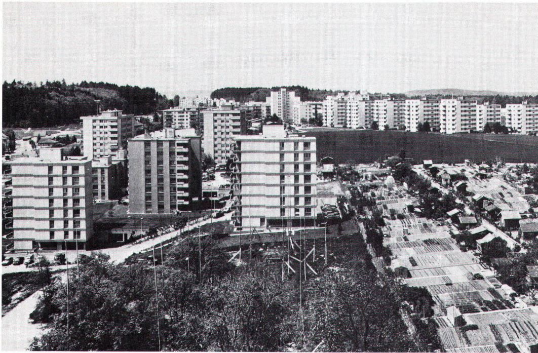
Produit typique de la «haute conjoncture»: nouveau quartier à Villars-sur-Glâne. Typisches Kind der Hochkonjunktur: Neubauquartier in Villars-sur-Glâne