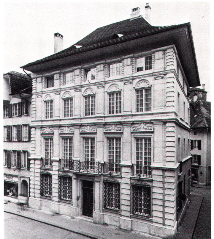
Bauberatung will nicht nur historische Bauten erhalten...