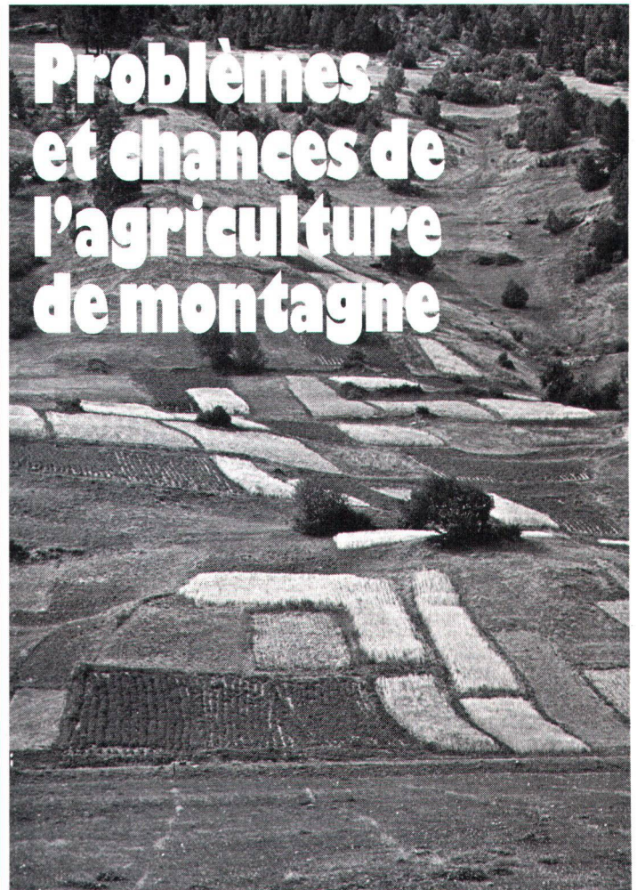
Le «paysage cultivé» traditionnel est devenu une rareté même dans la vallée de Conches.

Auch im Goms selten geworden: die traditionelle Kulturlandschaft