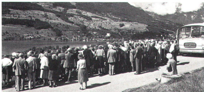
Augenschein im Gelände über die Linienführungsvarianten der N8 zwischen Sarnen und Lungern-Obsee

La discussion, le soir après le repas, a été vive, d'autant que les journalistes présents y ont pris part. La visite du paisible ermitage de Nicolas de Flue, le dimanche matin, faisait un symbolique contraste. La pluie ne favorisait pas l'esprit contemplatif, mais on a eu plaisir à se réchauffer en banquetant au «Kreuz» de Sachseln.