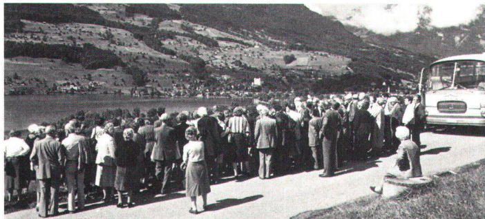
Augenschein im Gelände über die Linienführungsvarianten der N8 zwischen Sarnen und Lungern-Obsee

La discussion, le soir après le repas, a été vive, d'autant que les journalistes présents y ont pris part. La visite du paisible ermitage de Nicolas de Flue, le dimanche matin, faisait un symbolique contraste. La pluie ne favorisait pas l'esprit contemplatif, mais on a eu plaisir à se réchauffer en banquetant au «Kreuz» de Sachseln.