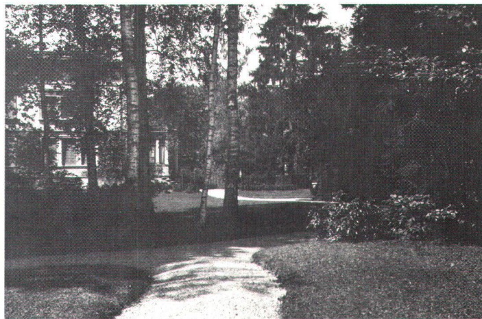
Gärten brauchen in Verdichtungszone nicht zum Verkehrswert versteuert zu werden, da die Öffentlichkeit die Erhaltung grüner Lungen unterstützt (Bild Steine).

Werden Beiträge der Denkmalpflege an die werterhaltenden Unterhaltskosten (im Ge-