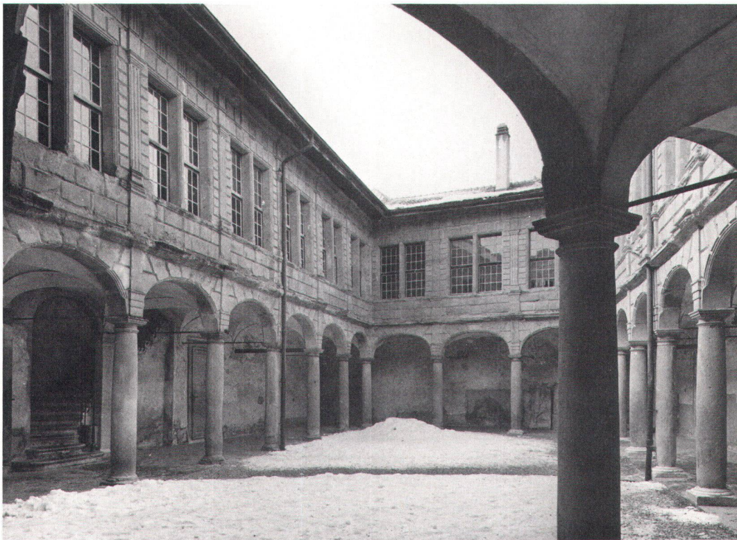
La durée des parties d'une construction dépend aussi de la qualité de son entretien (la cour du château d'Aubonne VD)

Die Lebensdauer einzelner Bauteile hängt auch von der Unterhaltsqualität ab.