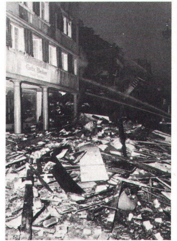
Innert weniger Monate sind die alten Städtchen von Wiedlisbach (links) und Lichtensteig Grossbränden zum Opfer gefallen

En quelques mois, les vieilles cités de Wiedlisbach (à g.) et Lichtensteig ont souffert de graves incendies.