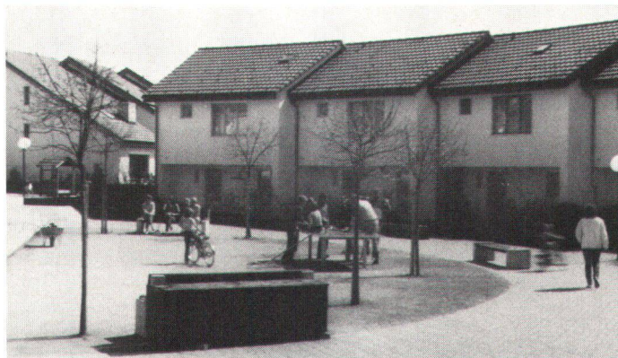
Verkehrsfreier «Dorfplatz» in der Überbauung «Lindenwiese» (Bild Kis).

Die Siedlungsform wird dabei wieder einen mehr städtischen Charakter erhalten und sich eindeutig von der Landschaft