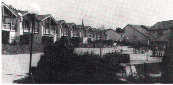
Bei dieser Hausreihe sind die Gärten auf den «Dorfplatz» ausgerichtet (Bild Kis).

Les jardins de cette lignée de maisons s'orientent du côté de la «place du village».