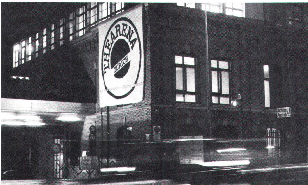
La «Rote Fabrik» de Zurich-Wollishofen sert aujourd'hui de bâtiment polyvalent. Die «Rote Fabrik» in Zürich-Wollishofen dient heute als Mehrzweckgebäude.

Seit 1963 erscheint eine Zeitschrift mit dem Titel « Industrial Archeology », und allmählich bekundeten die nationalen Museen ihr Interesse an dem neuen Thema, und er entwickelte sich die Industriearchäologie auch in andern Ländern – in Belgien, in der Bundesrepublik, in Frankreich und in den Vereinigten Staaten. Anlässlich eines Colloquiums 1976 in Frankreich verlangten die Fachleute, dass der Erhaltung des industriellen Erbes die selbe Aufmerk-