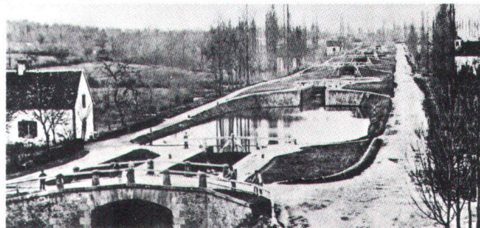
Les sept écluses du canal du Centre (France) Die sieben Schleusen des «Canal du Centre» (Archivbild).

Bemühungen um unser industrielles Erbe reichen aber bis in das Jahr 1866 zurück, als der Delsberger Ingenieur Auguste Quiquerez über die von ihm freigelegten Eisenerzöfen aus keltischer Zeit berichtete. Auf dem Gebiet des heutigen Kantons Jura fand er deren 230!