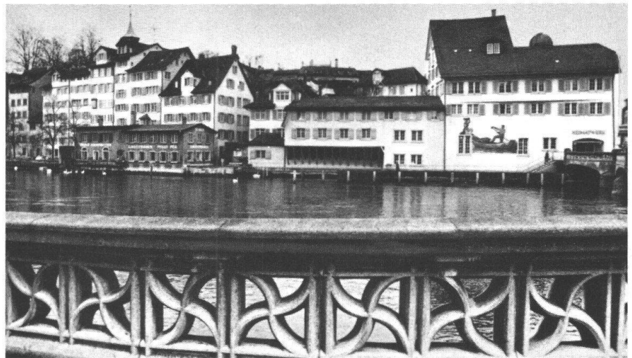
Seit 1939 ist das Heimatwerk in dem mit einem Nauen verzierten «Heimethuus» am Ufer der Limmat in Zürich zu Hause.

Natürlich bildet das Heimatwerk nicht nur im Falle Luzis die Brücke zwischen Berg und Tal. Nein, die Palette des Angebotes der kunsthandwerklichen Erzeugnisse in den Geschäften des Heimatwerkes ist vielfältig: Neben den Produkten aus zahlrei-