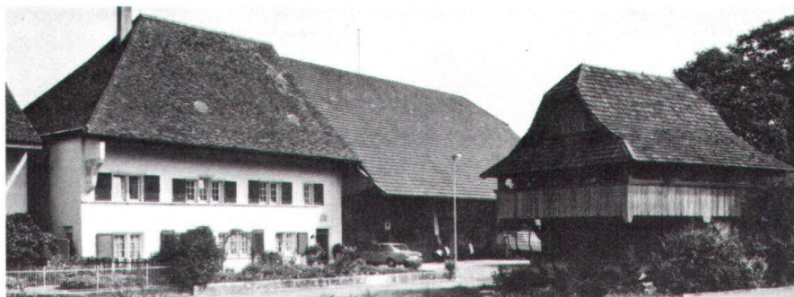
Le nouveau droit soleurois des constructions oblige les communes à protéger les sites urbains et villageois, les lieux historiques, la nature et le patrimoine architectural. Photo: Maison de l'«Untervogt» et grange Ramseyer, à Neuendorf SO: leur avenir est-il assuré?.

Soleure: Nouveau droit des constructions