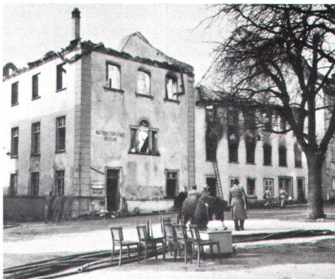
Il faut préserver les œuvres d'art et les richesses de la civilisation, souvent irremplaçables, non seulement des événements guerriers mais aussi des détériorations par intempéries et incendies.

collections propres de la Confédération, la célèbre collection Reinhart, à Winterthour, possède un abri; il y en a un aussi dans l'ancien bâtiment du Poly, à Zurich. On étudie actuellement le projet d'une installation au Kirchenfeld, à Berne, qui répondrait aux besoins de divers musées de ce quartier, ainsi que de la Bibliothèque nationale.»