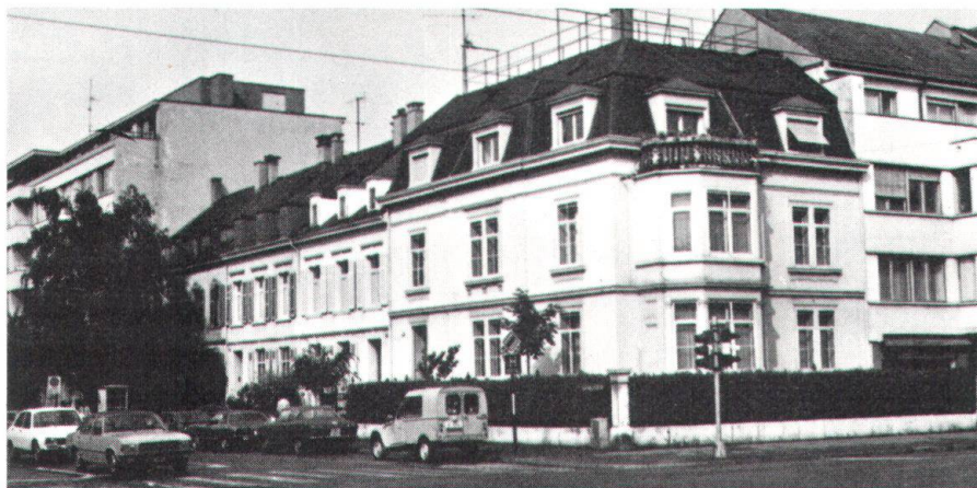
Dank der Einsprache des Basler Heimatschutzes konnte verhindert werden, dass dieses spätklassizistische Ensemble an der Leimenstrasse durch einen Teilabbruch entstellt wird.

Zu erwarten war, dass im Hinblick auf verstärkte denkmal- und stadtbildschützende Massnahmen finanzstarke Bauspekulationskreise zu einem Angriff auf die Bausubstanz ansetzen würden. Auf Anregung der Basler Sektion des Schweizer Heimatschutzes wurde im Grossen Rat kurz vor der Sommerpause 1977 ein «Anzug betreffend Bemühungen um Rettung unseres Stadtbildes» eingereicht, der bis