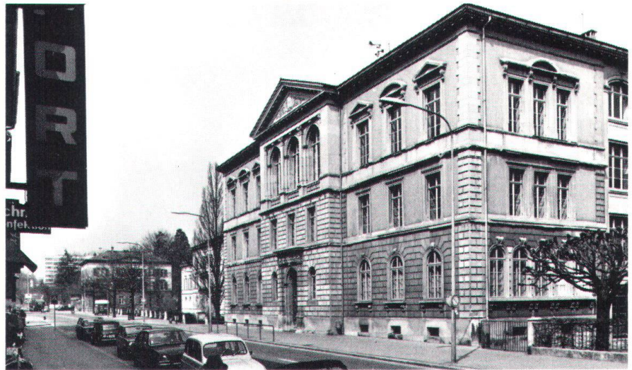
Die Höhere Stadtschule Glarus von der Hauptstrasse aus gesehen, im Hintergrund die Platzanlage am Spielhof mit dem Gerichtsgebäude und dem Mercier-Haus als Platzabschluss.

Glarus: Landrat fordert Heimatschutz heraus