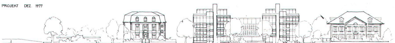
VILLA LAUPENECK, 1902