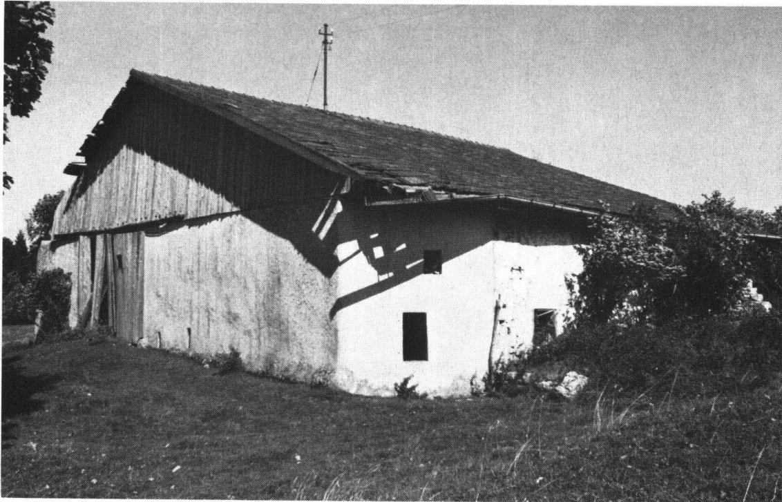
Bois-Rebetez-Dessus. Vieille ferme avec l'angle rabattu. Le Comité jurassien envisage d'y installer un musée paysan

darf auch mitgeteilt werden, dass heute feststeht, dass das Haus Marktgasse 40 integral erhalten bleibt. Die Eigentümer haben sich überzeugen lassen, dass ihre Pläne verwirklicht werden können, ohne dieses wertvolle Barockhaus zu opfern.