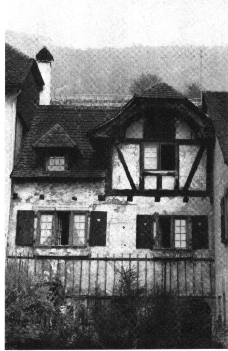
Ligerz. Dorfgasse vor der Neupflasterung. – Haus Gaberel vor der Restaurierung

«Réalisations exemplaires», die im Kanton Bern ausgeführt werden, sind daher als Schwerpunkt der Anstrengungen, teilweise über mehrere Jahre hin, zu verstehen.