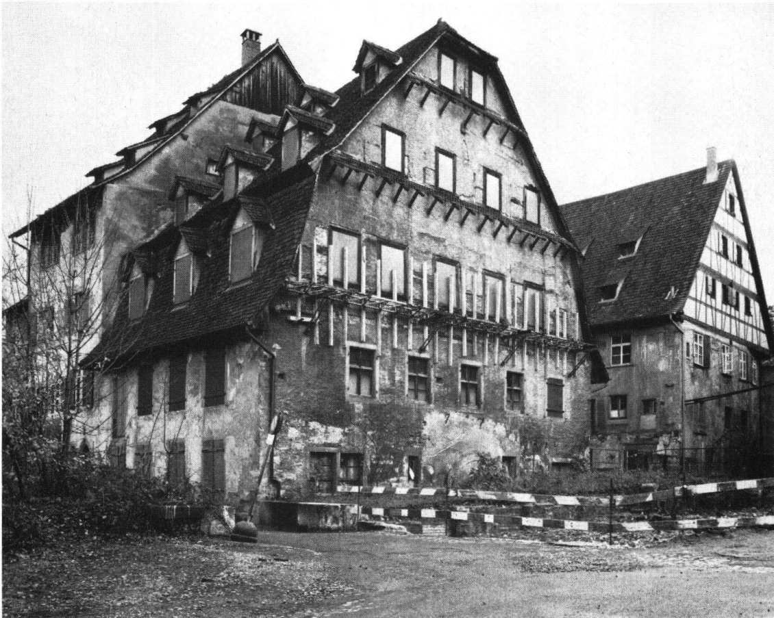
Basel. Albantal. Alte Hammerschmiede (links) und Rychenmühle. Im Vordergrund abgeschrankt das Areal der abgebrannten Stegreifmühle, die wiederaufgebaut werden soll

Weiter soll versucht werden, für ein anderes grosses Einzelobjekt, die Safranzunft , die notwendigen Restaurierungszuschüsse beizubringen. Dieses historistische Bauwerk zeichnet sich durch grossen Formenreichtum und bauplastischen Schmuck aus (um 1900 vom phantasiereichen Architekten G.A. Visscher van Gaasbeek errichtet).