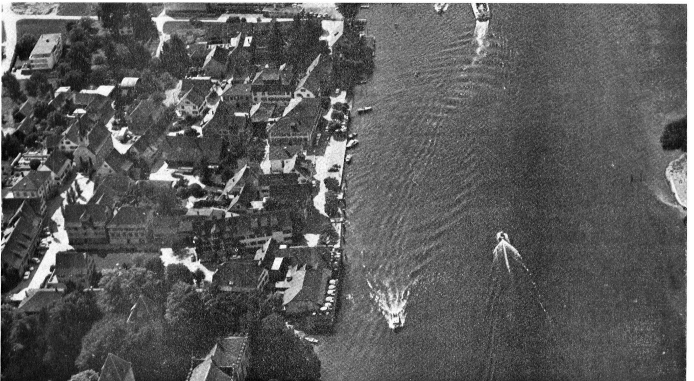
Gottlieben, am Rhein zwischen dem Bodensee und dem Untersee, stellt mit seiner «Drachenburg» und weiteren Riegelbauten ein erhaltenswertes Ortsbild in einer Landschaft von nationaler Bedeutung dar.