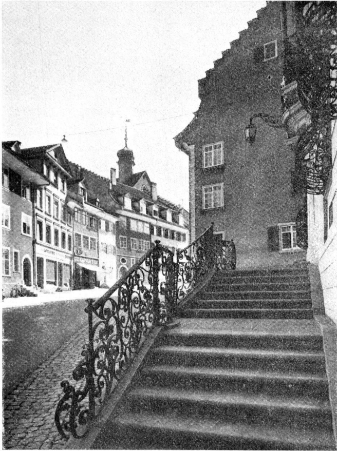
Das Bild der Hauptgasse von Bischofszell ist nach dem Stadtbrand von 1743 sehr grosszügig neugestaltet worden; es erfreut sich auch heute liebevoller Pflege. Rechts das Rathaus mit seiner schönen Freitreppe.