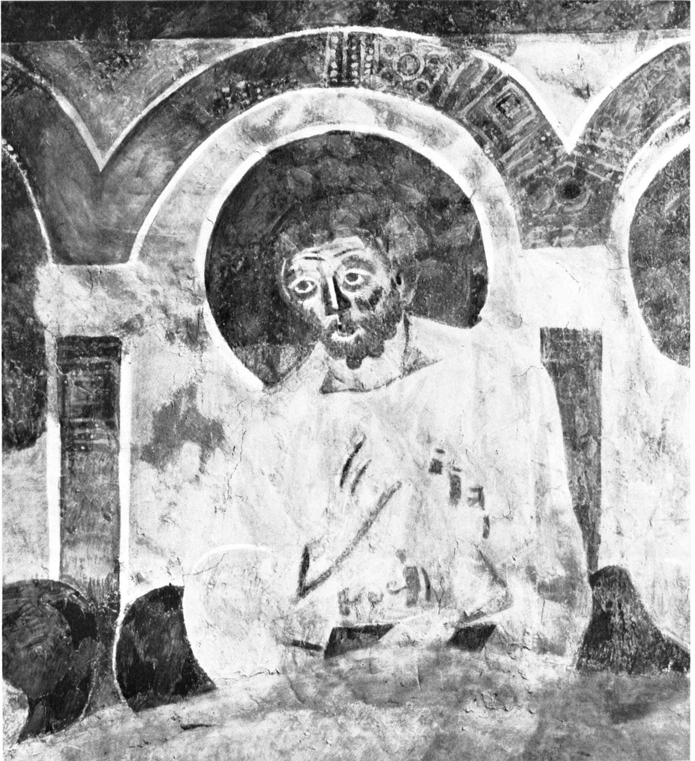
Fragment du Jugement dernier de la paroi ouest, que la tribune des religieuses cache en grande partie aux visiteurs; disciple siégeant à côté du Seigneur. Tableau qui fait particulièrement bien sentir la parenté de style de ces fresques avec l'art monumental de la fin de l'antiquité.

Ci-contre, en haut: La Fuite en Egypte; en bas: Fragment du cycle des fresques romanes de l'abside nord, consacrées à la légende de Pierre et Paul.