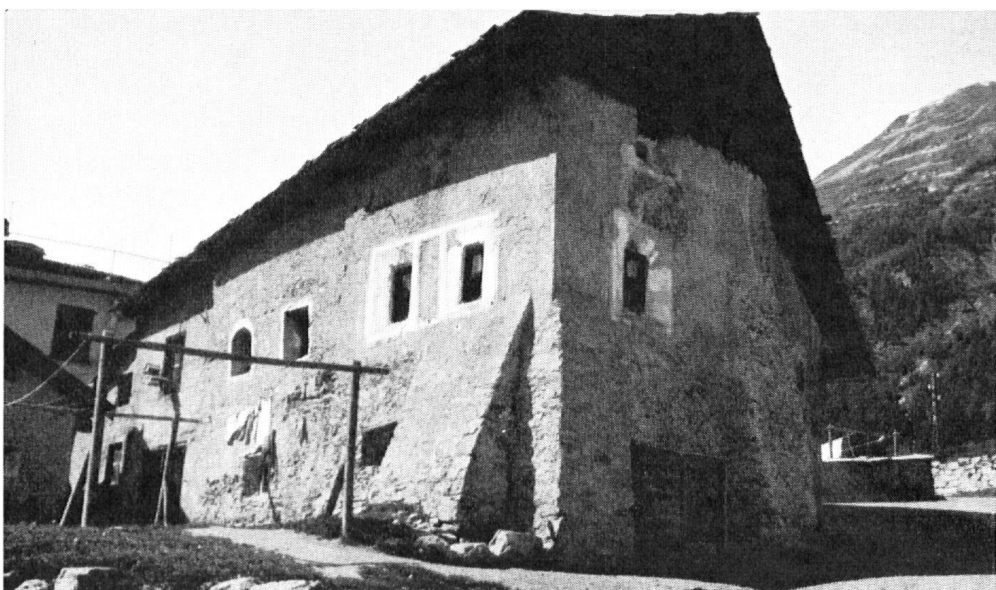
Encore une maison, à Pontresina, qui a été détruite. Exemple intéressant de l'architecture engadinoise ancienne.