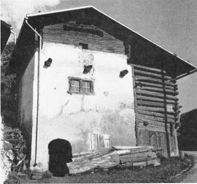
Maison d'habitation, comprenant deux pièces, à Scharans, dans le Domleschg; inhabité, en péril.