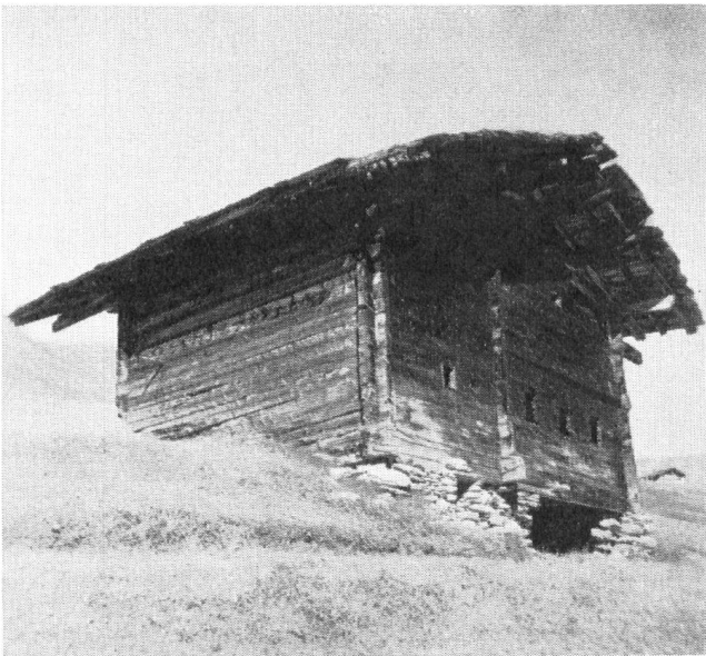
Deux habitations-tours, se touchant, datant du moyen âge, à Salouf, près de Tiefencastel.