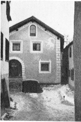
Ci-contre: Une maison d'un type fort singulier, à Zuoz, récemment démolie. Le vide qu'elle laisse dans le village n'a pas été comblé; mais la maison située derrière (voir ci-dessus) présente une façade recrépie et décorée de graffiti.

Le monde physique des Grisons est aussi très caractéristique. Populations, types de colonies, économie, varient avec l'altitude, avec l'exposition, avec le climat, avec la végétation. Dans son histoire cependant, dans maints édifices qui sont les témoins encore debout d'âges révolus, demeure encore bien visible l'importance des routes et des cols alpestres qui reliaient l'Allemagne du Sud à l'Italie.