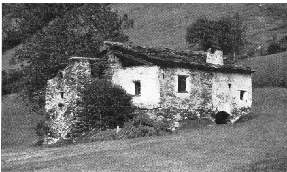
Etable et « tour » avec adjonctions ultérieures, à Taliade dans le val de Poschiavo. Partiellement en ruine.