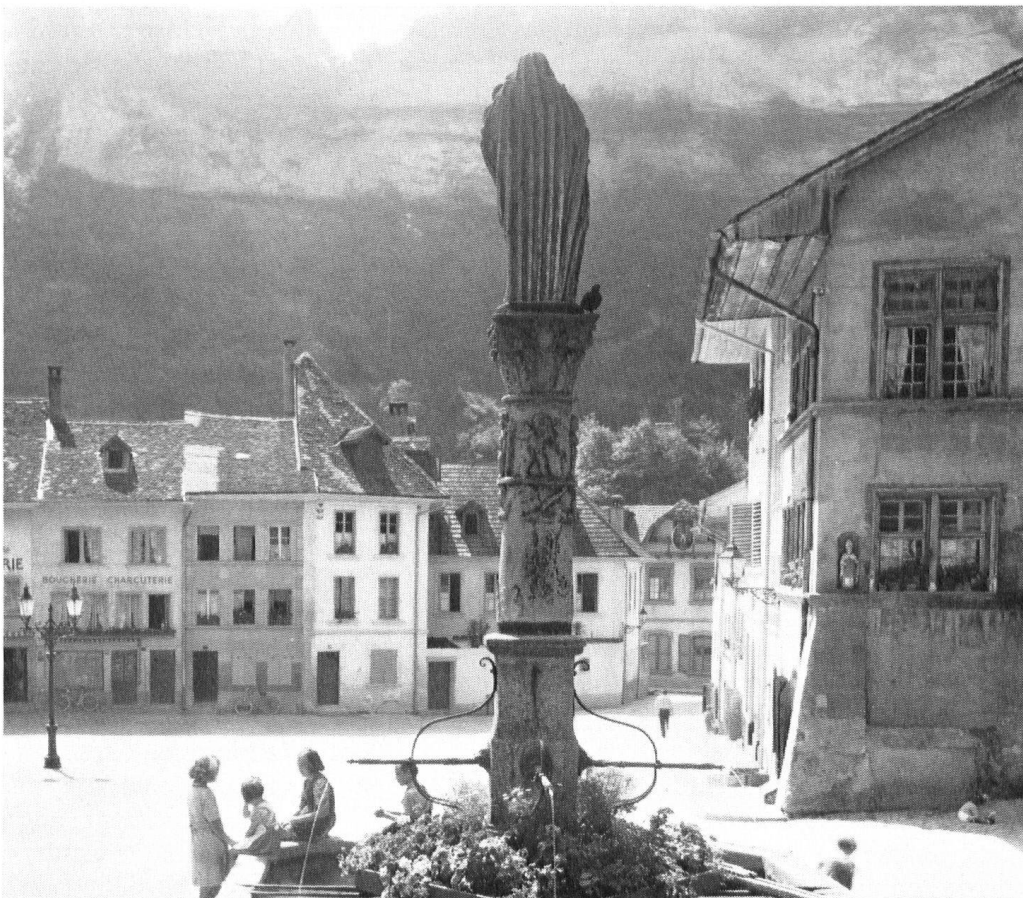
Der große St. Johannesplatz. Nicht nur die Schauseiten, auch die Baukörper der Häuser sind – wie unsere Bilder zeigen – unverändert geblieben. Alles hat menschlichen Maßstab, der kein Ergebnis des bloßen Zufalls ist. Wer Bürger werden wollte, mußte ein Haus in der Stadt sein eigen nennen. So entstand ein glücklicher Wettstreit zwischen Kaufleuten und Handwerkern, der zur Verschönerung der Stadt beitrug.