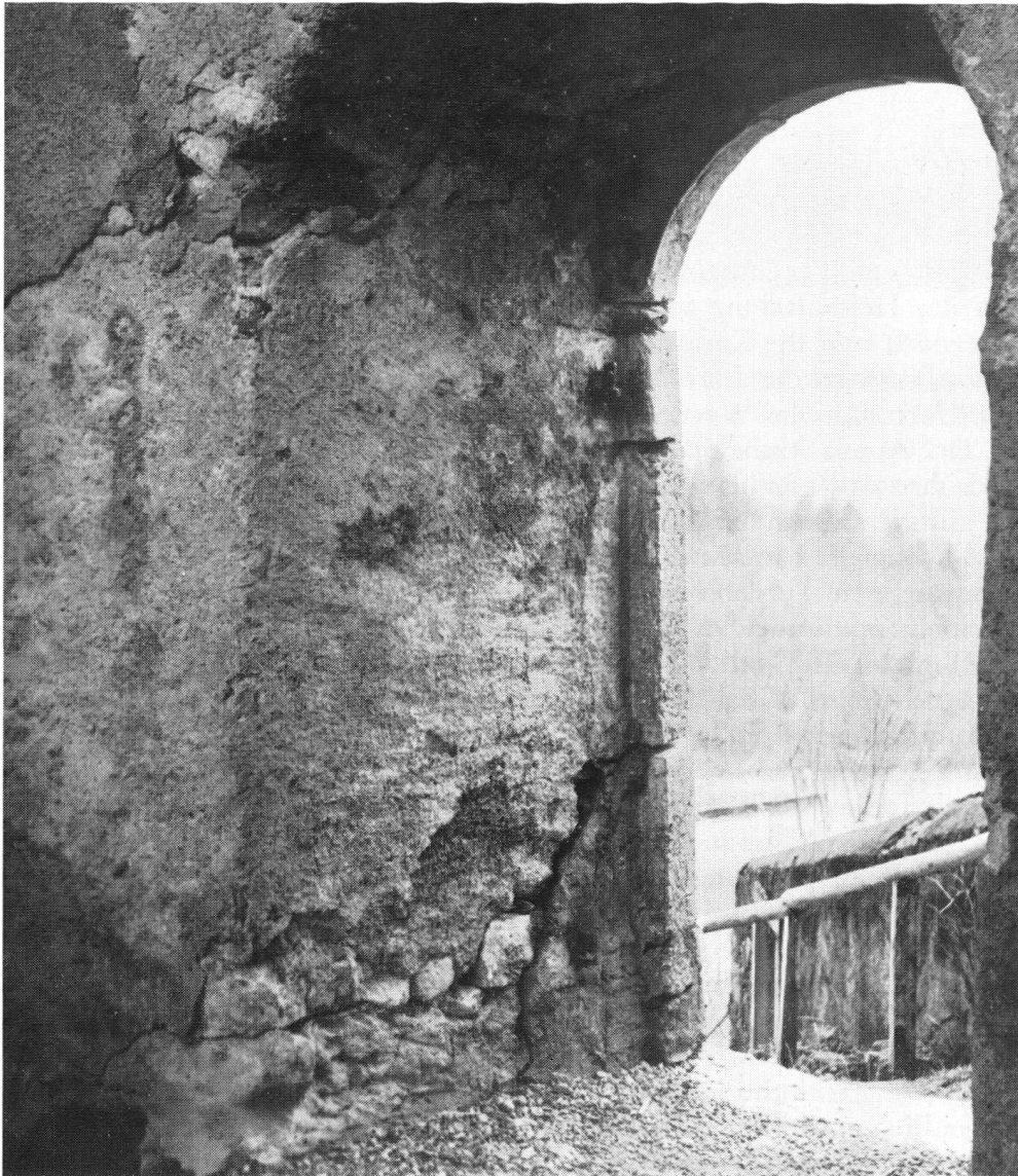
Stadtforte im Süden, durch die man über einen reizvollen Pfad auf die Weiden am Berg- hang hinabsteigt. Auch die brüchig gewordene Stadtmauer verdient es, gefestigt und erhalten zu werden.