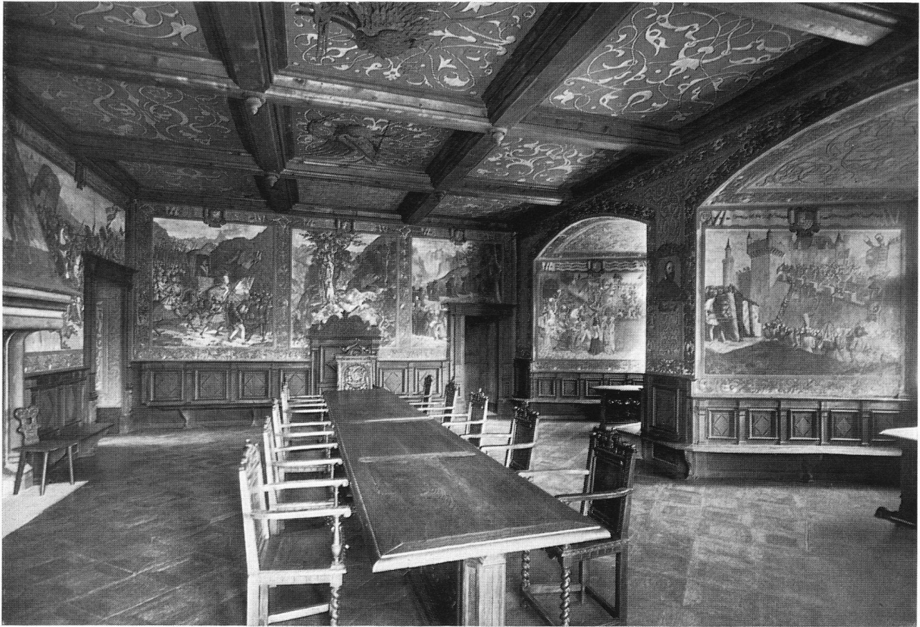
Der Rittersaal, den der Maler Daniel Bovy mit geschichtlichen Ereignissen und Legenden der Grafschaft ausgeschmückt hat.