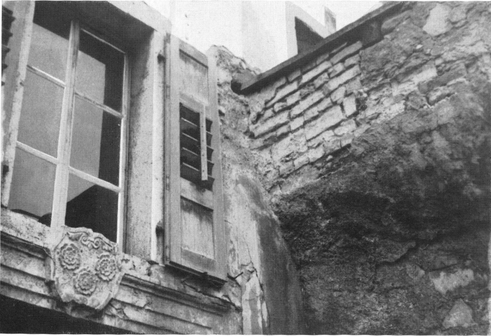
Das Dreirosen-Wappen inmitten des Zerfalls!