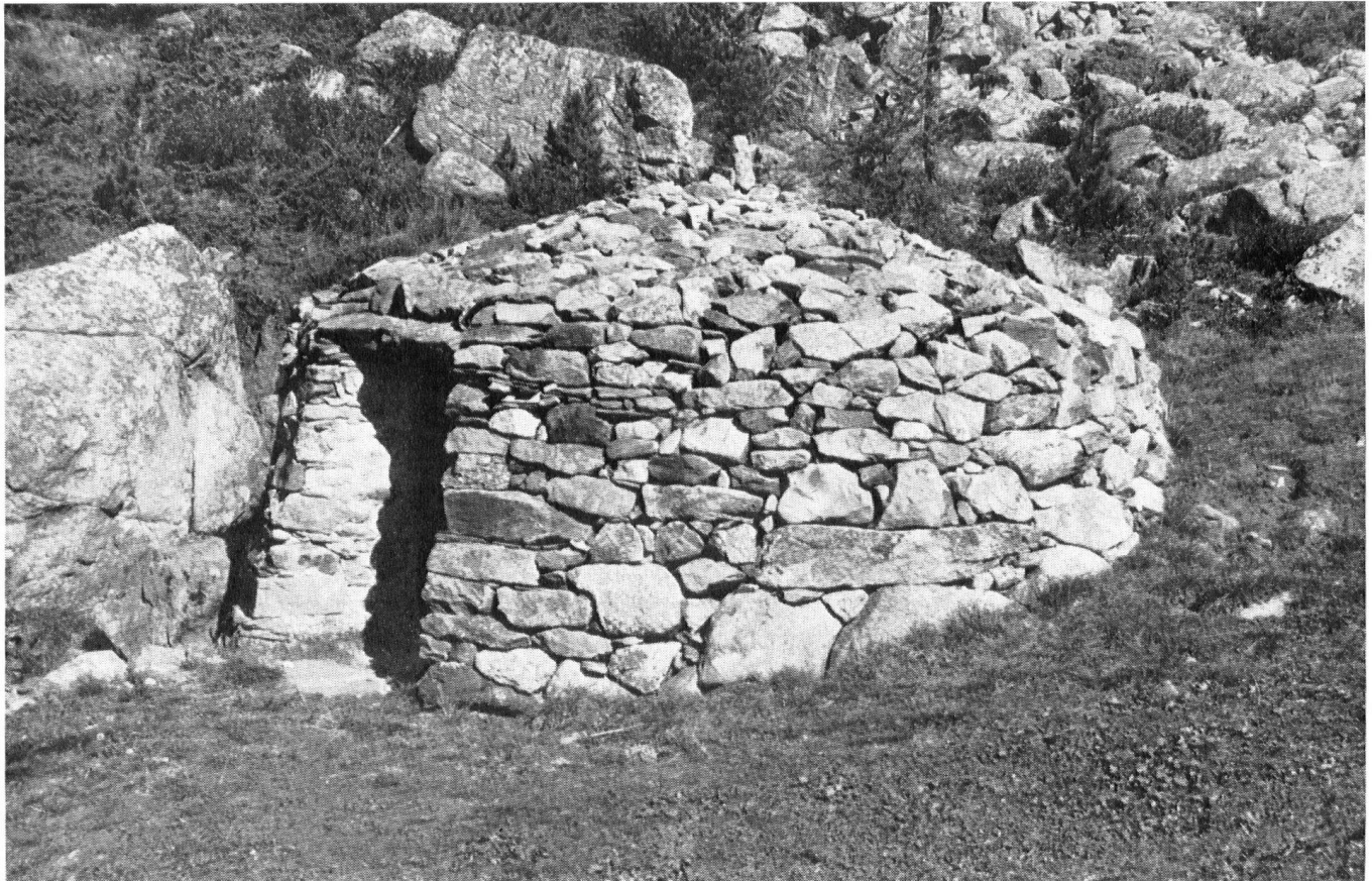
Un des « trulli » sur l'Alpe de San Romerio qui domine le lac de Poschiavo GR. Le « trullo » est une hutte de pierre sèche en demi-sphère, d'une haute antiquité, qui sert aujourd'hui de cave à lait.