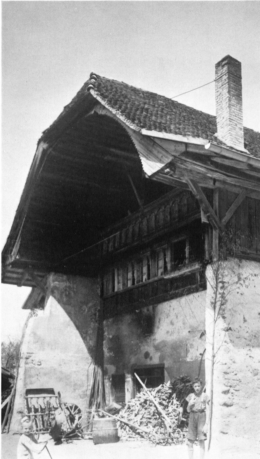
Le musée devra contenir des édifices de l'époque artisanale, aujourd'hui fortement menacés de disparaître. Voici une forge. Cottens FR.