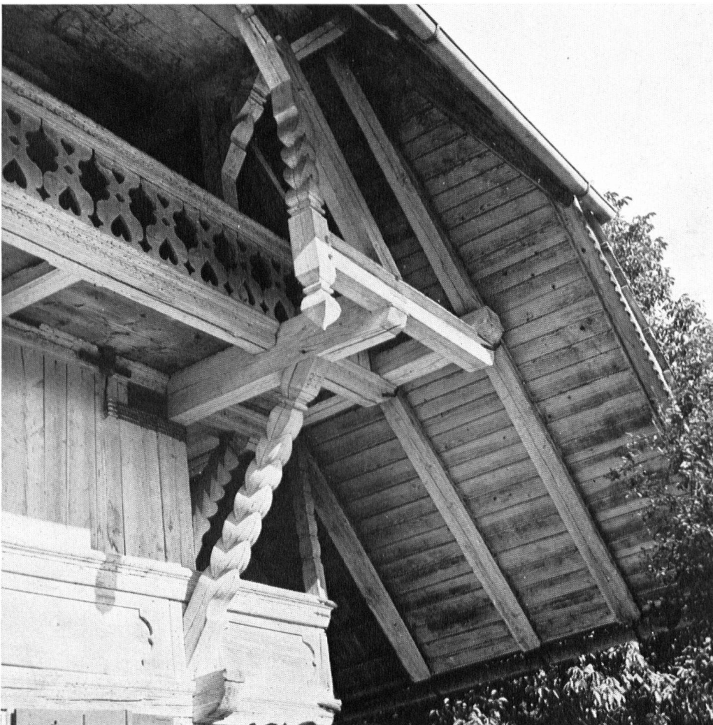
Page 79 en haut: Grenier bernois, avec galeries décorées de motifs sculptés et peints, précieux ouvrage de l'artisanat paysan.