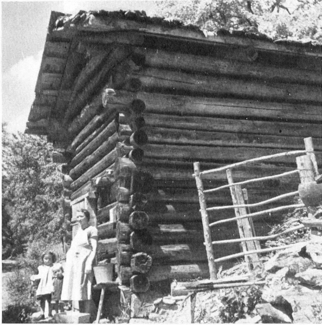
Le musée de plein air comprendra aussi des bâtiments mineurs. Nous présentons ici un « Gaden » (Prätigau GR) dont les parois sont fermées de troncs de sapins écorcés.