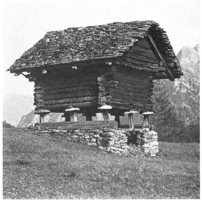
Un grenier, analogue aux raccards valaisans, mais en territoire tessinois (près de Campi, dans le val Maggia). Les Walser, originaires du Haut-Valais, ont apporté dans les vallées où ils se sont établis leurs coutumes propres, et aussi l'architecture de leur région d'origine.