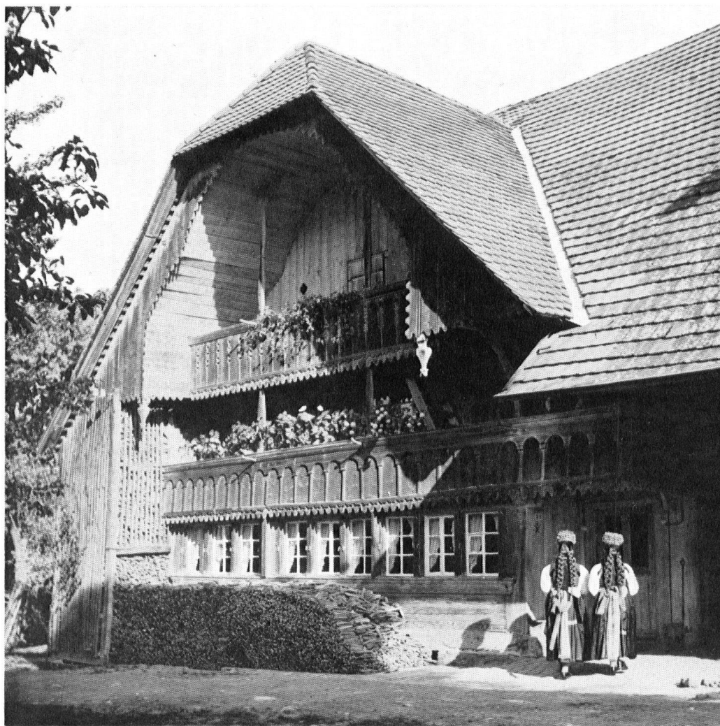
Somptueuse ferme fri-bourgeoise. Guin.