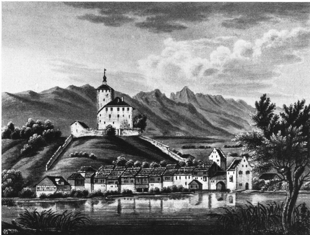
Werdenberg zu Beginn des 19. Jahrhunderts nach einem Aquatinta-Blatt im Besitze der Zentralbibliothek Zürich.