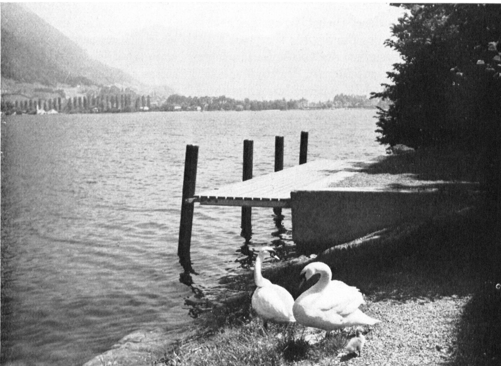
An Stelle eines alten, hässlichen, nunmehr verschwundenen Holz- und Landeschuppens steht heute dieser idyllische kleine Schiffsteg.