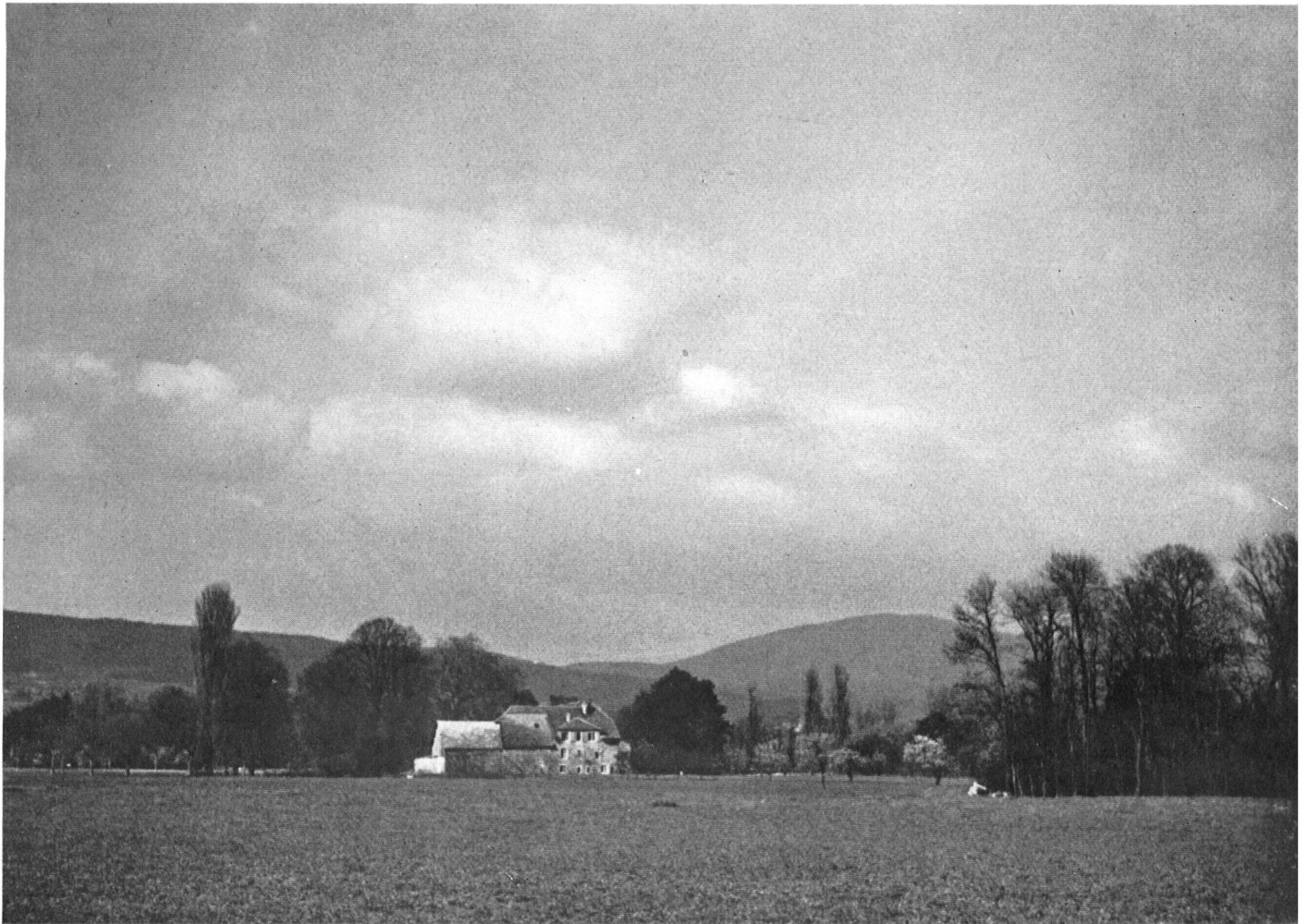
La ferme des Prés d'Areuse, ancien séchoir à indiennes.

Mais il n'y a pas que la poésie, chose d'ailleurs si nécessaire: la plaine d'Areuse est cultivée. Elle compte parmi les meilleures terres à blé du canton.