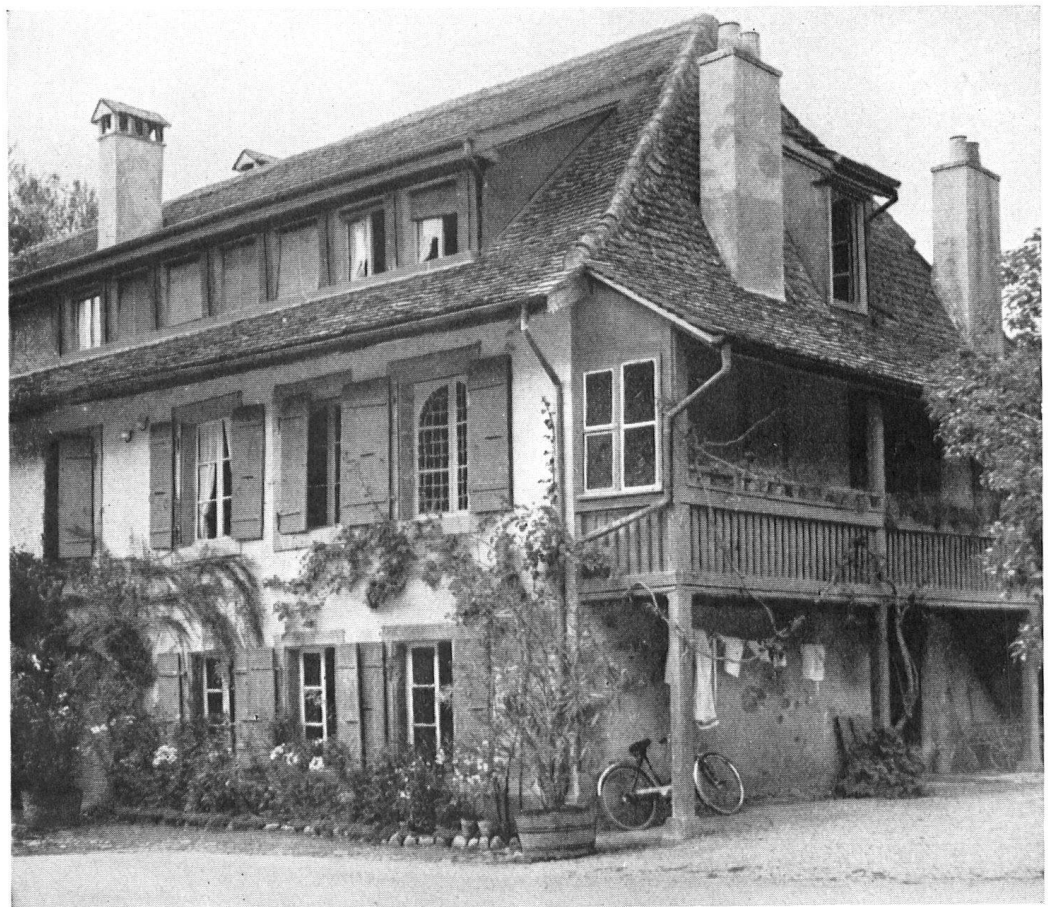
Vue des maisons de Retraite de Grandchamp.