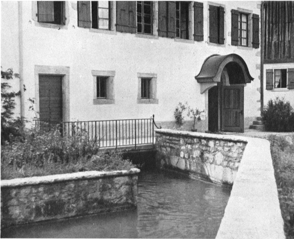
Le «bief» de Grandchamp.

de Neuchâtel aura une très grande responsabilité à prendre lorsqu'il sera sollicité d'accorder des crédits pour le Syndicat d'initiative.