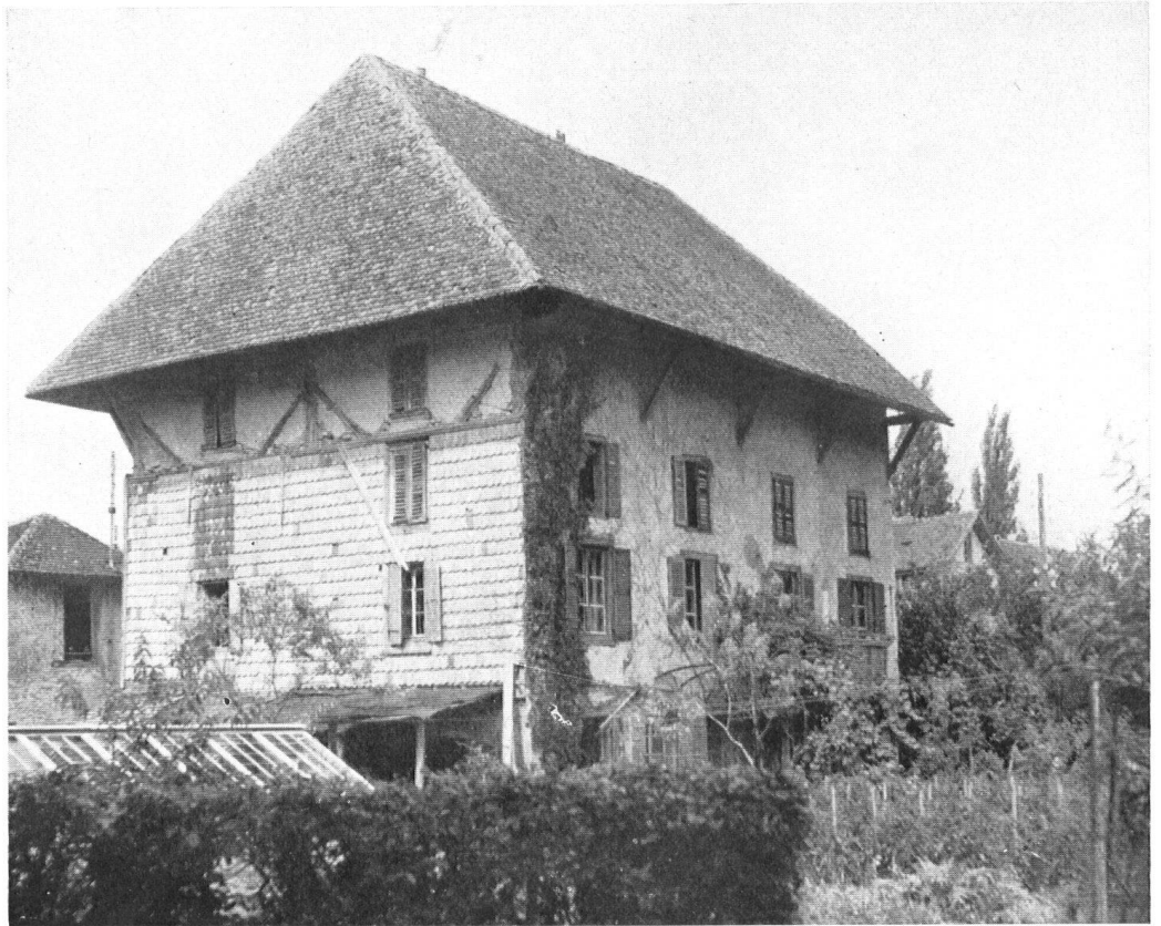
Ancien séchoir à indiennes (Grandchamp)