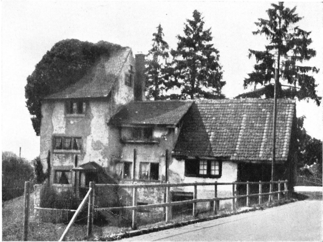
Das Haus «zu den drei Tannen» in Zürich-Enge war vollkommen verwahrlost und sollte abgebrochen werden.

Les «Trois Sapins» de Zurich-Enge étaient à ce point misérables que la pioche et la hache semblaient seules capables de mettre fin à leur décrépitude.