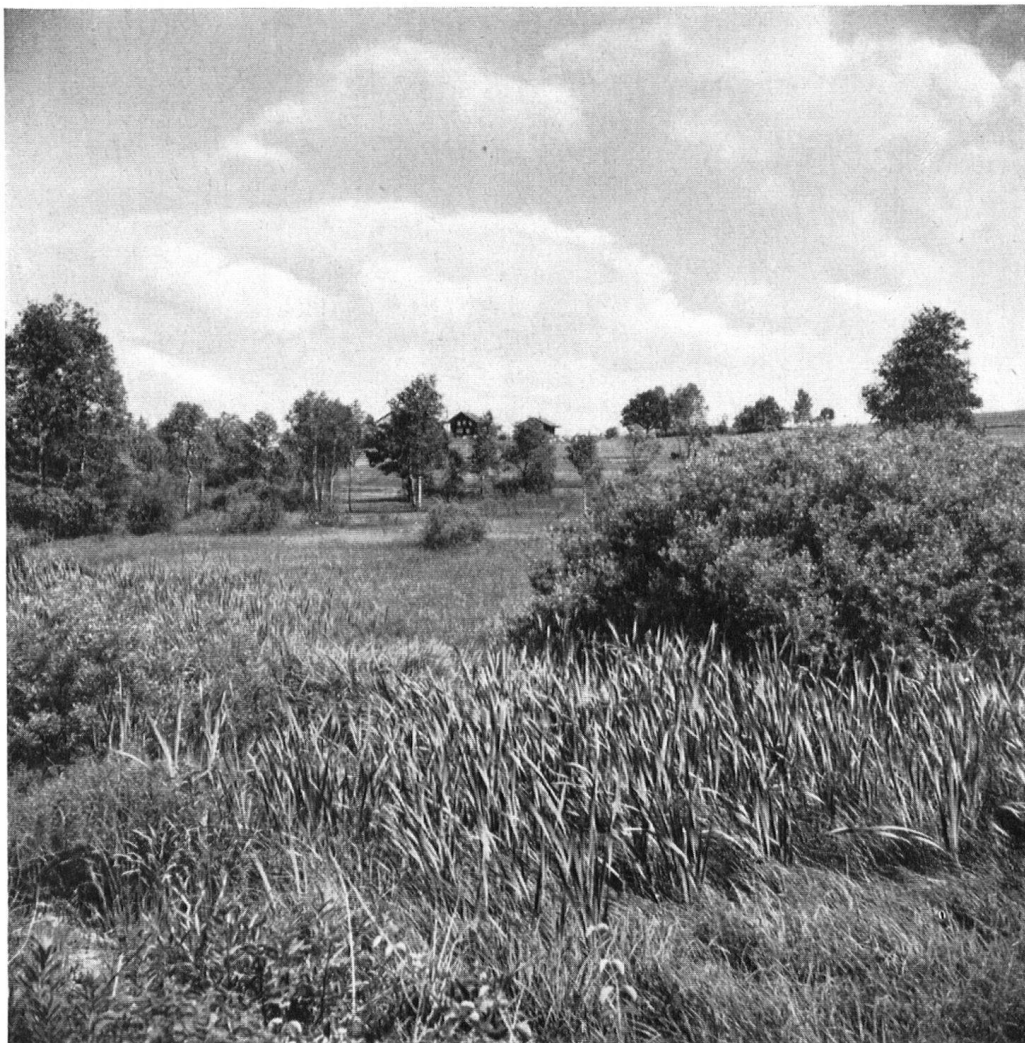
Naturreservat »Schönenhof« bei Wallisellen. Das dicht neben der großen Autostraße liegende Moor wurde von Schuttablagerungen befreit.