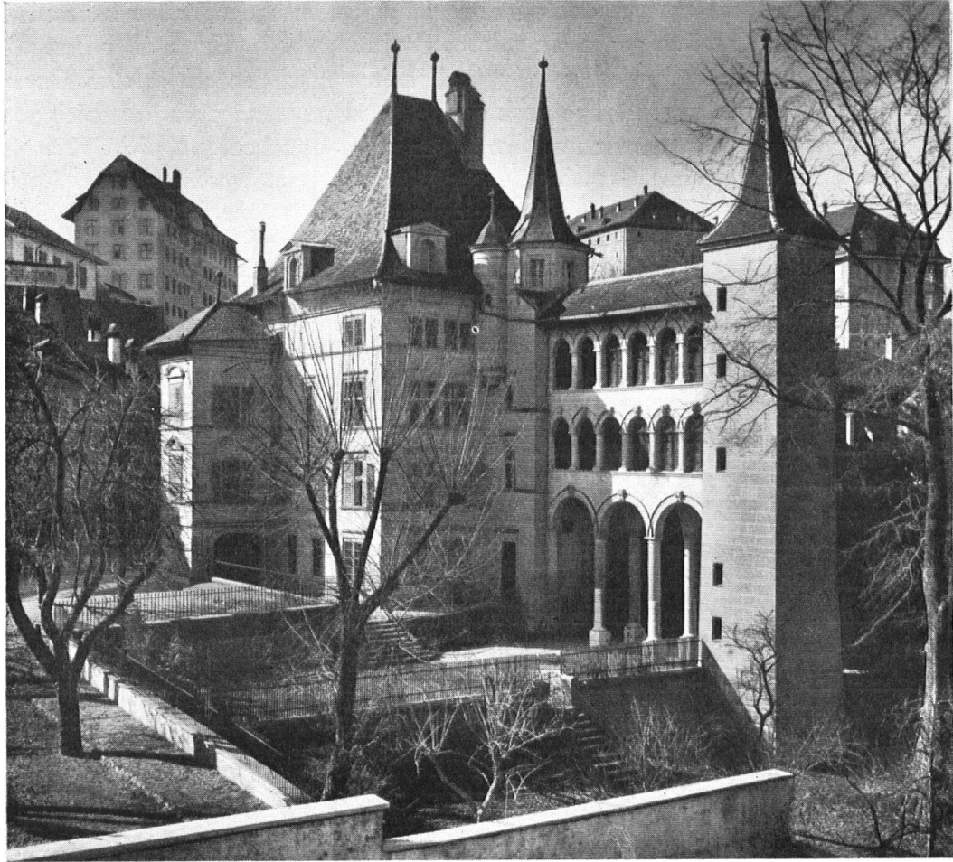
Un monument bien conservé: L'ancien hôtel particulier, construit en 1585—87 pour le capitaine Jean Ratzé par l'architecte français Jean Fumal. Actuellement Musée d'art et d'histoire à Fribourg. Fribourg. Das Museum für Kunst und Geschichte, ehemals Herrensitz, 1585—87 erbaut für den Kapitän Jean Ratzé.