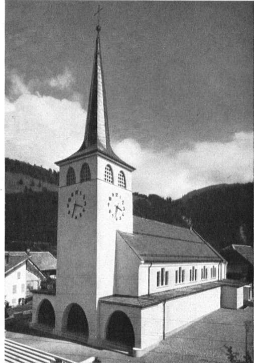
Autrefois et aujourd'hui: L'église de Grandvillard.

A gauche: L'ancienne, du 17 me siècle, que le Heimatschutz, en vain, tenta de préserver! A droite: La nouvelle, construite en 1936—37.