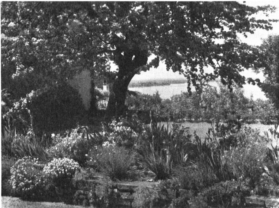
Garten mit alten Bäumen, blühenden Stauden und Mauern. Schloss Wiggen. — De vieux arbres, des arbustes en fleurs, des murs.