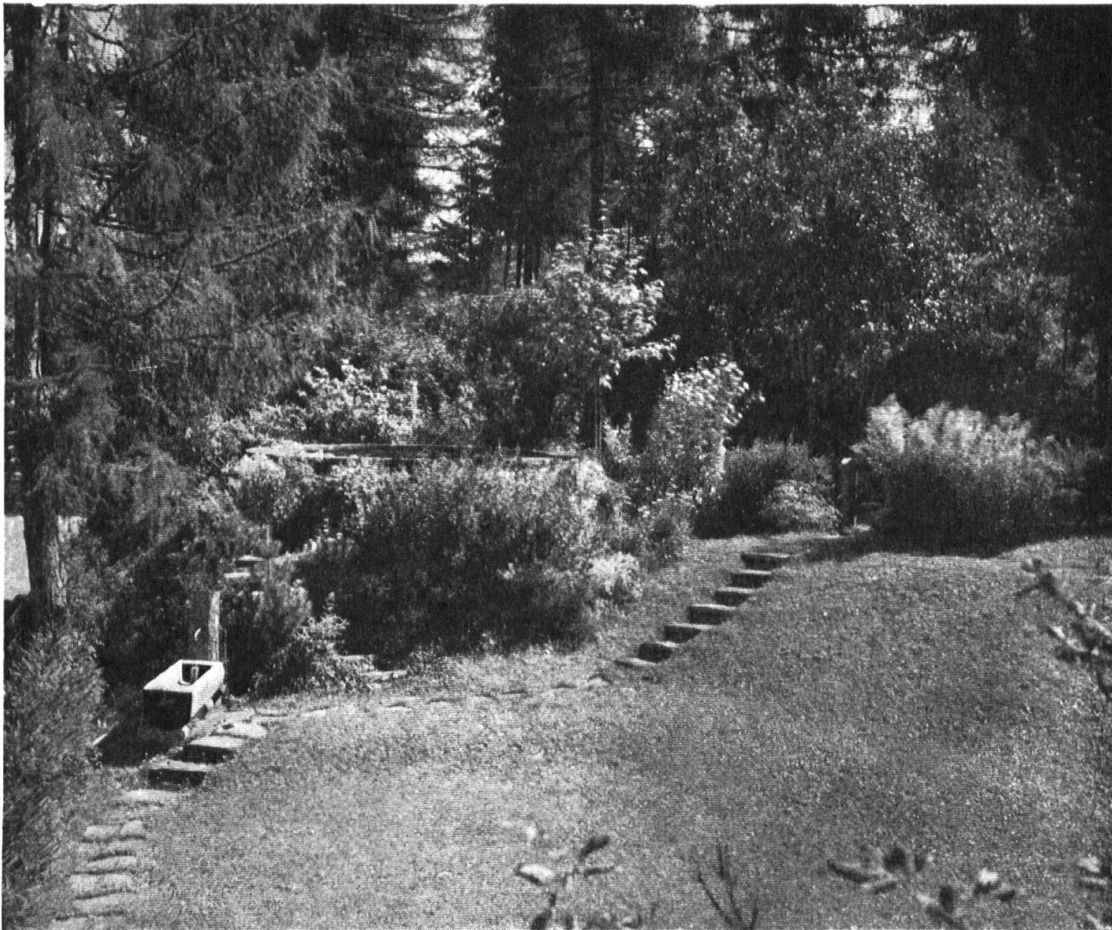
Garten, der sich zwanglos einem sehr bewegten Boden anschmiegt. — Un jardin qui ne dérange pas la beauté naturelle du terrain. — Walter Leder, Zürich.