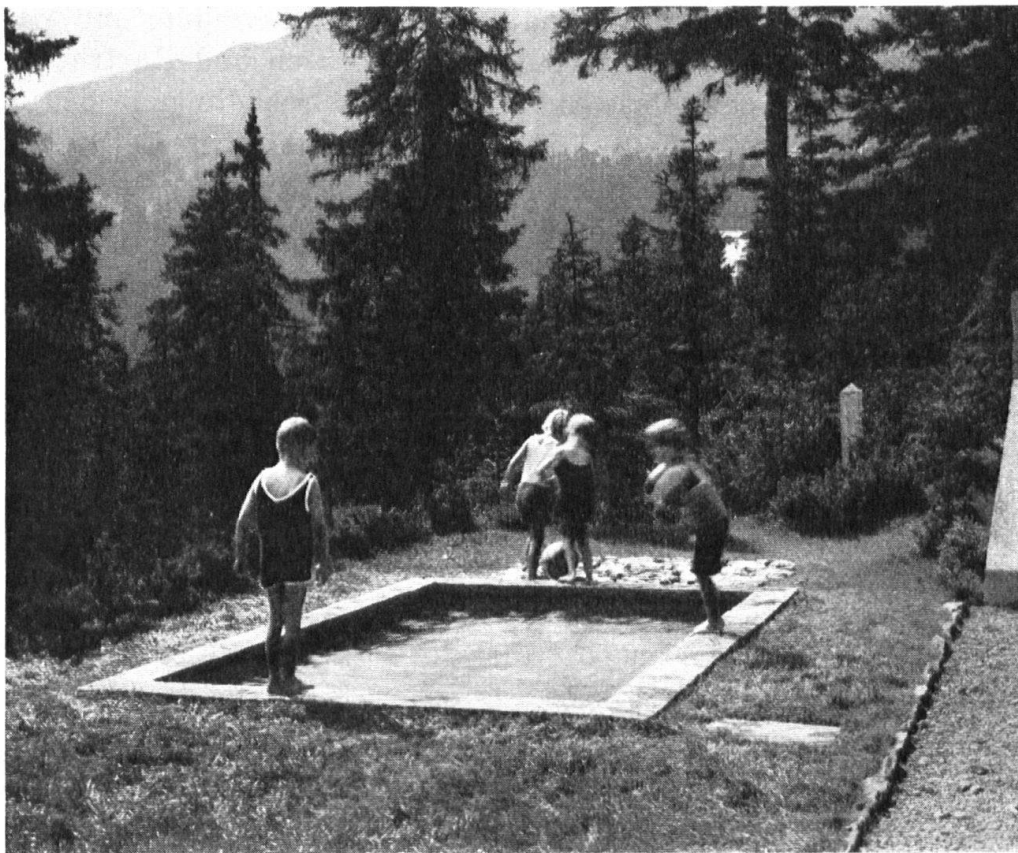
Planschbecken eines Gartens im Hochgebirge. — Bassin pour les enfants d'un jardin dans les montagnes. — J. E. Schweizer, Gartenarchitekt, Glarus-Basel.