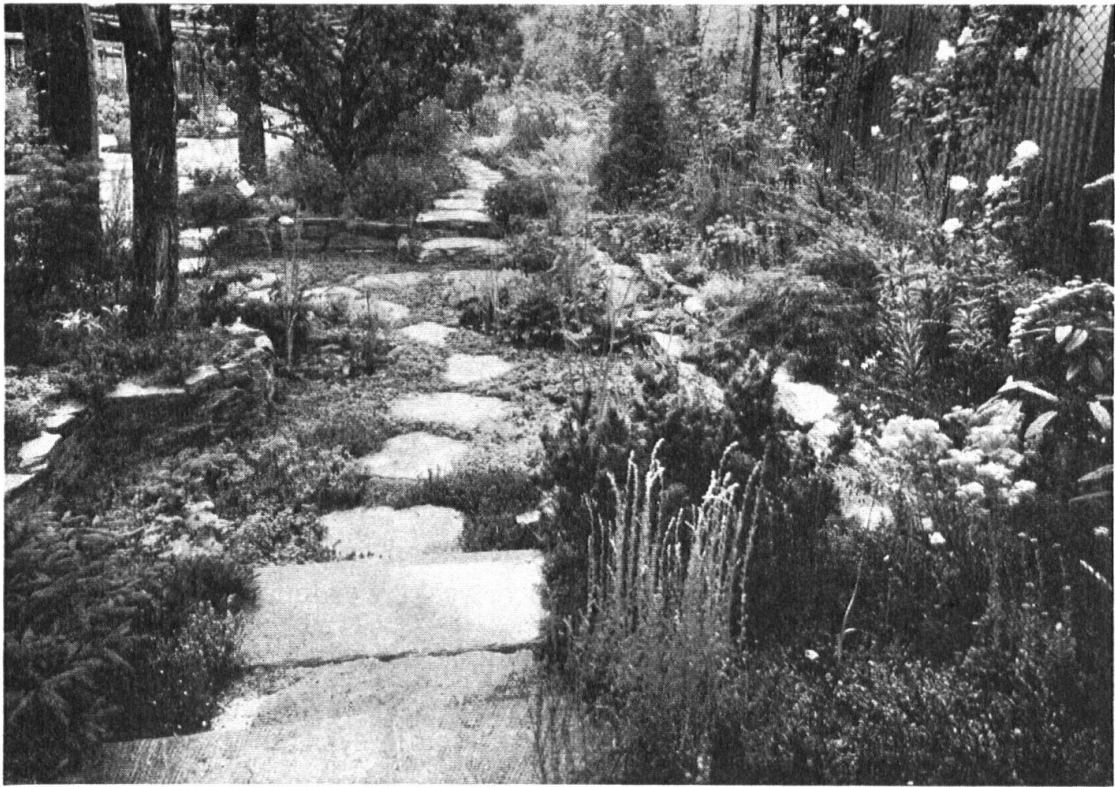
Wasserpflanzen mit Trittsteinen auf Moos. — Plantes aquatiques avec de grandes dalles brutes posées sur la mousse. — Arnold Vogt, Erlenbach-Zürich.