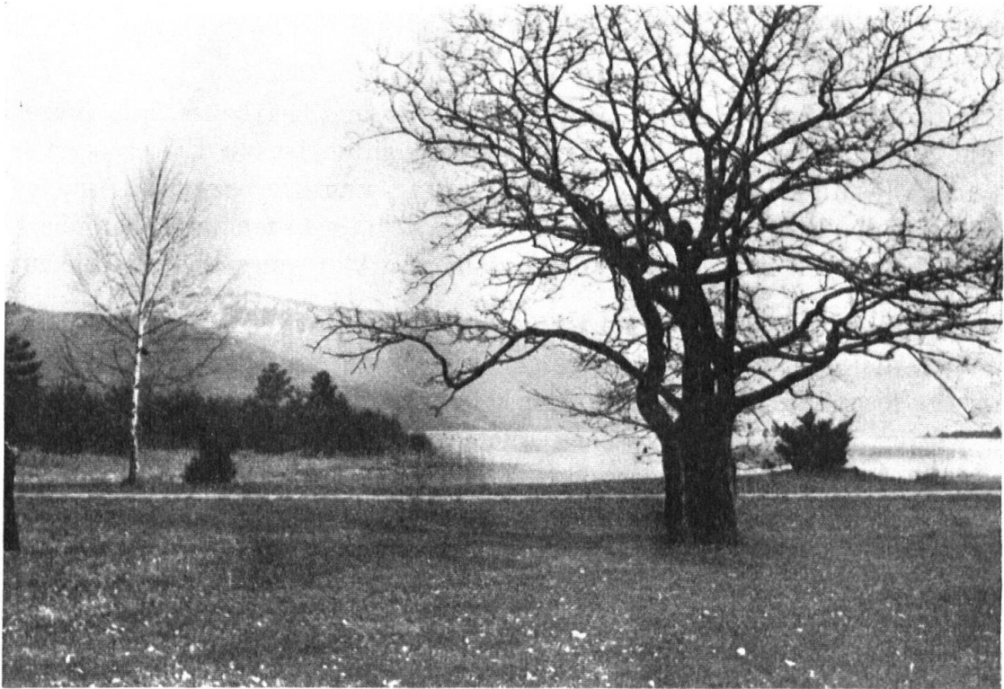
Landschaftliche Neupflanzung am Thunersee. — Jardin s'adaptant au paysage. — Gebrüder Mertens, Zürich.